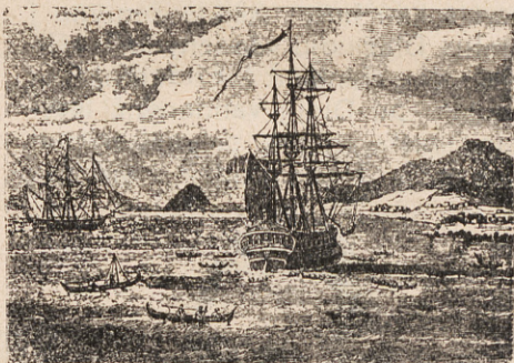
Kuko laivai ties N. Zelandijos salomis.

gais negalais užtaisė burinius au-deklų skylę ir sulaukė tekančių laivan vandens. Buvo išmesta jūron kanuolės ir šiaip mažiau bereikalingi daiktai. Palengvintas laivas pakilo ir nuslydo laimingai nuo sėklumos. Bet jų vargai buvo dar negalas. Kukas, norėdamas geriau pataisyti laivą, priplaukė krantą. Čia buvo pastatyta laikina kalvė ir imtasi taisyti laivo skylę. Nevaisingi laukiniai užpuldinėjo ir visai trukdė darbą. Kukas liepė juos šaudyti. Laukiniai, pabūgę šūvių, atsitraukė ir padegė mišką. Kilo didelis gaisras, kuris sudegino Kuko kalvę, aplink esantį mišką ir daug naudingų daiktų, sukrautų ant kranto. Galutinai po ilgų vargų laivas buvo pataisytas ir galėjo tęsti savo kelionę.