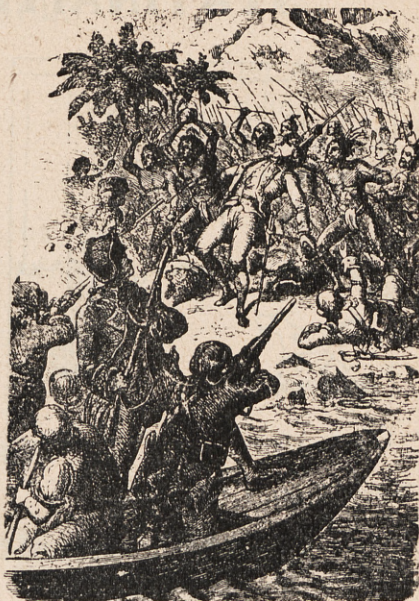
Kapitono Kuko mirtis.

1779 m. Kukas su savo laivais pasiekė Sandvičo salyną. Priplaukę didžiausią Havajų salą, išlipo anglai žemynan. Vietos gyventojai sutiko anglus pradžioje labai vaišingai. Mat, Kuką tų kelionių metu pažinojo gerai Havajų gyventojai ir skaitė jį esant dievu. Tad laukiniai jautiesi labai laimingi, kad dievaitis Kukas teikėsi juo aplankyti. Nieks nenujautė, kad tos išvykos būsiąs toks liūdnas galas. Laukiniai nešė daug įvairaus maisto dalykų ir aukojo dievui—Kukui. Kukas, neatsilikdamas skolingas, irgi daug padovanojo laukiniams įvairių daiktų. Pagaliau, kada tyrimo darbai buvo baigti, anglai norėjo plaukti toliau. Bet laukiniai, nenorėdami skirtis su savo dievu, nenorėjo išleisti anglių. Ilgainiui tie bičiuliški anglių su laukiniais santykiai iš prieteliškų pasidarė labai nedraugiški. Prasidėjo dažni vaidai ir muštynės. Prieidavę prie ginkluotų susirėmimų. Vieno tokio susirėmimo metu žuvo Kukas. Anglų su juo buvęs negausus būrys, netekęs savo vado, paskubėjo į valtis ir, palikęs Kuko lavoną, atplaukė laivan. Laukiniai suruošė puotą ir suvalgė Kuko lavoną. Ir kada antrą dieną išlipo stiprus anglų jūrininkų būrys ir, išvaikęs