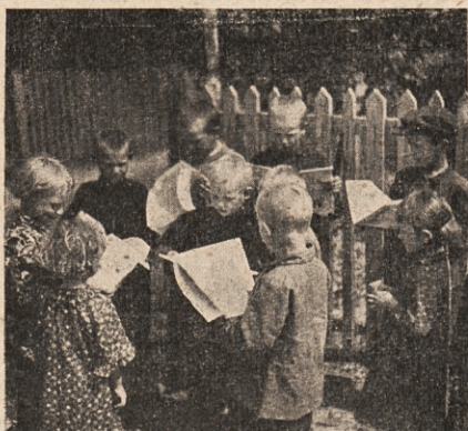
Mes gavome „Varpelį“