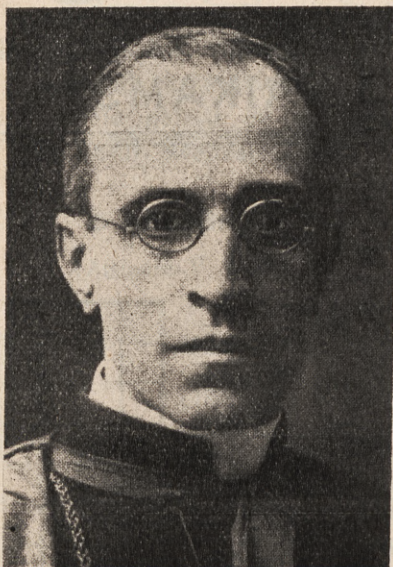
POPIEŽIUS PIJUS XII

Kardinolai — artimiausieji šv. Tėvo pagelbininkai. Vieni jų gyvena Ryme, arti šv. Tėvo, kiti — kituose kraštuose. Šv. Tėvas rūpinasi viso pasaulio katalikais, katalikų yra daug, tad vienam žmogui tų reikalų aprėpti neįmanoma, reikalingi pagelbininkai. Šv. Tėvas jų pats pasirenka, ir ne bet kurių: tik aukštojo mokslo, gabių, išmintingų ir maldingų žmonių.