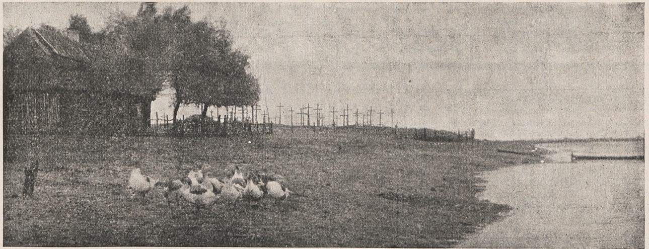
Krajobraz z nad Stochodu.

mitowany będzie pochód artystów i literatów z całej Polski na Skatkę, dla złożenia hołdu prochom Wyspiańskiego.