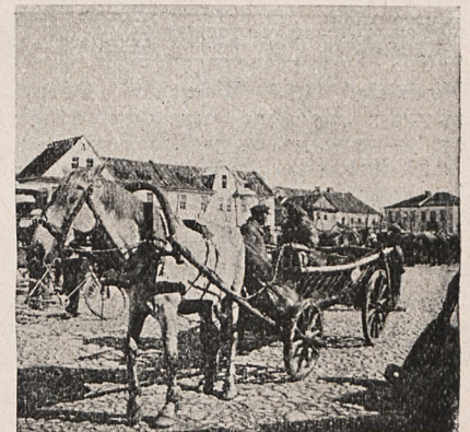
Fragment z targu w Kobryniu.