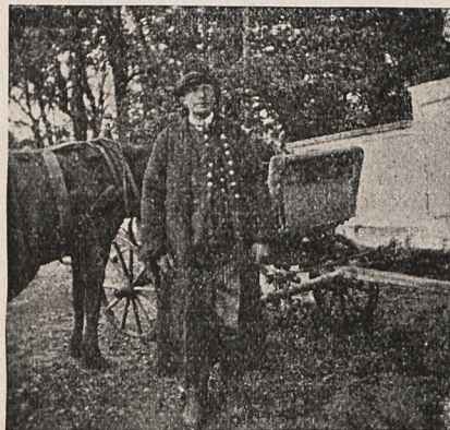
Łowiczanin kolonista przed kościołem w Kobryniu.