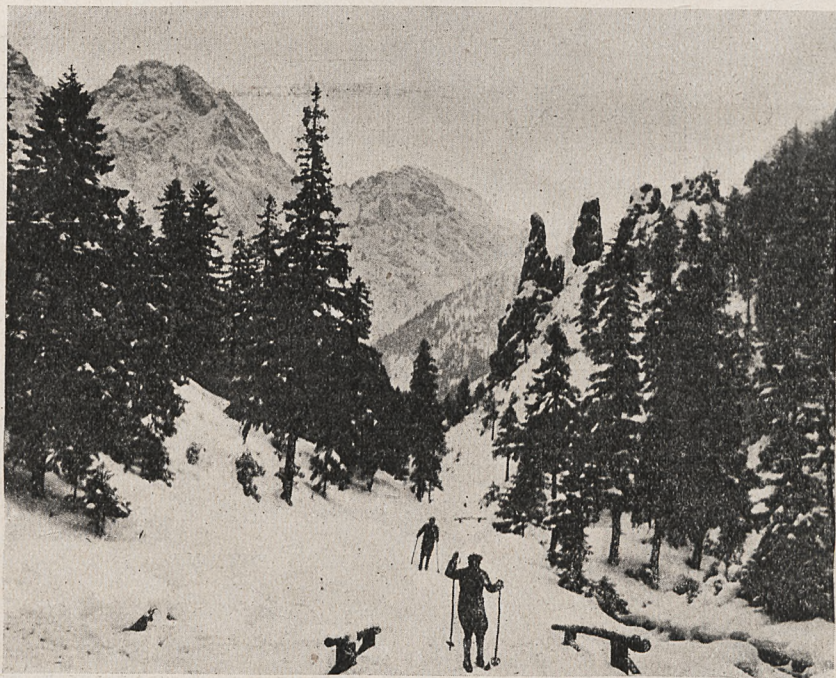
Narciarstwo jeden z najzdrowszych sportów zimowych.

Tegoż dnia, w przerwie koncertu z Warszawy, w godz. 18.00—18.30, trans-