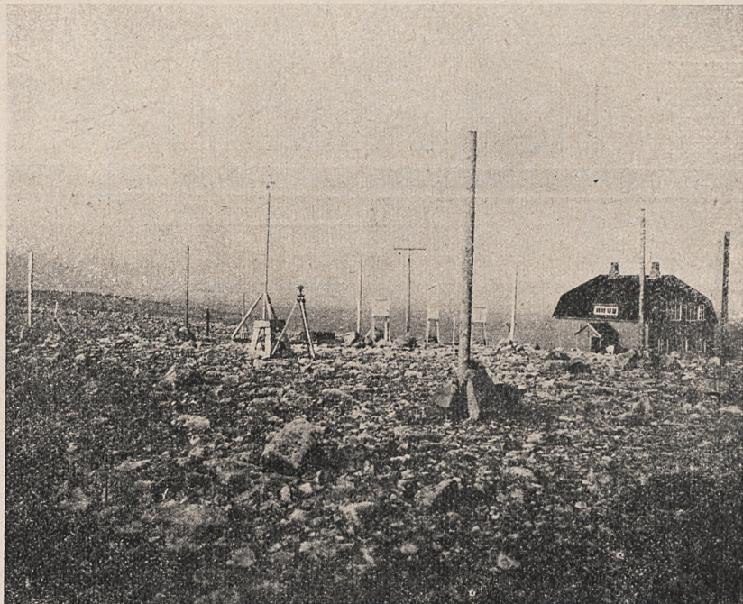
Stacja obserwacyjna dla zorzy polarnej i stacja meteorologiczna na Wyspie Niedźwiedziej.

W wieczór wigilijny odbyła się audycja wigilijna, dla oddalonych od