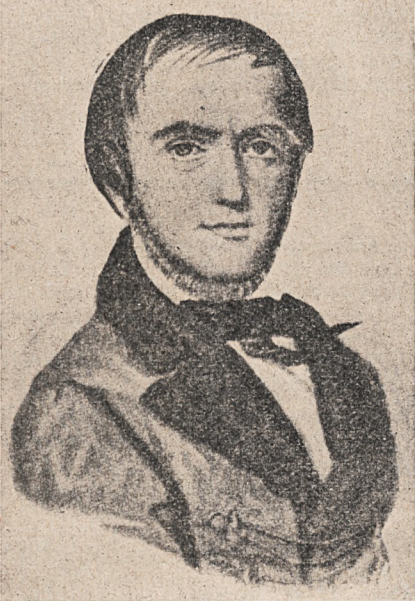
Józef Bohdan Zaleski.