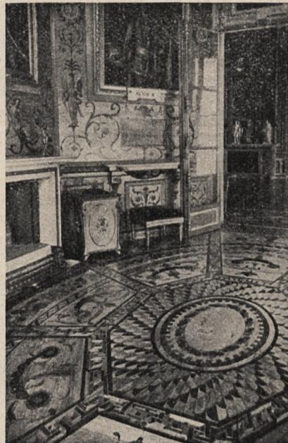
Sekretny gabinet króla Stanisława Augusta z portretami ówczesnych panujących.

Dawniej jednak, przed wielu, wielu laty było inaczej. Nieprzebyte puszcze