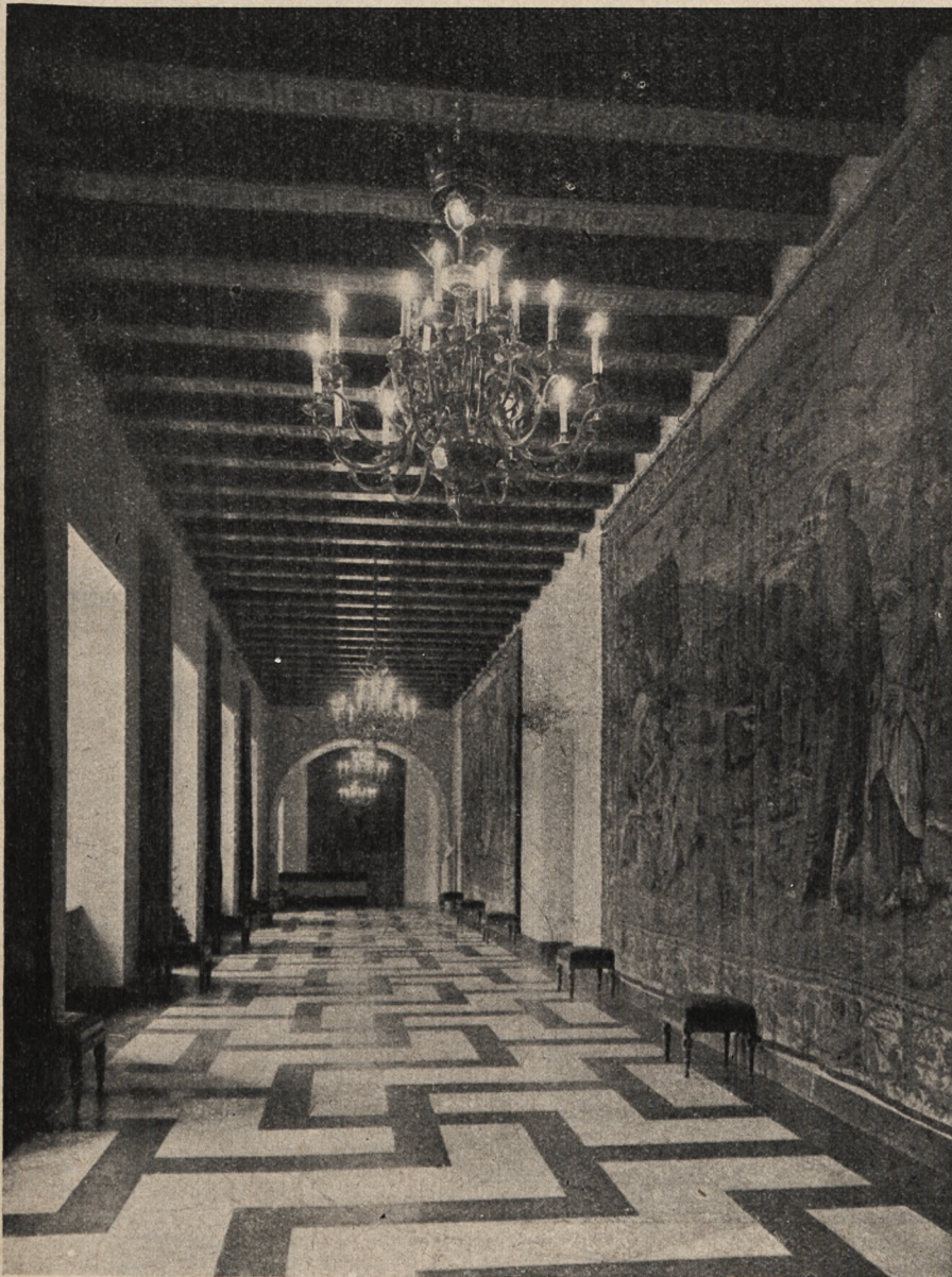
PRZEDSIONEK PROWADZĄCY DO SALI RYCERSKIEJ ZAMKU WARSZAWSKIEGO.

Programy na tydzień od 8/I do 14/I | Cena numeru bez przesyłki gr. 25