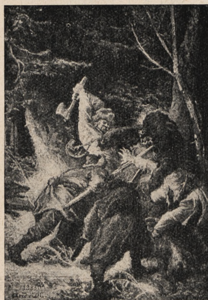
Polowanie na niedźwiedzia pg. Andriollego.

U nas ruch oszczędnościowy zatacza coraz szersze kręgi, mimo kryzysu nawet i braku gotówki. Kryzys nauczył nas zresztą oszczędności, tak jak dewaluacja nauczyła nas życia nad stan. ot z godziny na godzinę najpierw od podwyżki do podwyżki, następnie zaś od zaliczki do zaliczki. Dziś ludzie orjentują się, że nie tylko nie należy wydawać więcej niż się ma, lecz prze-