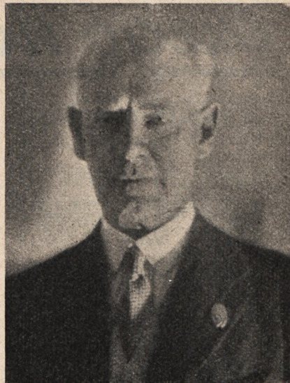
John Galsworthy, znakomity powieściopisarz angielski, (nagroda Nobla) zmarł w tych dniach.

Poza świetnymi przekładami kilku dzieł Nietzschego, długoletnia praca pisarska Berenta zamyka się w pięciu zaledwie powieściach: „Fachowiec” — „Próchno” — „Ozimina” — „Żywe kamienie” i obecnie „Wywłaszczenie muz”