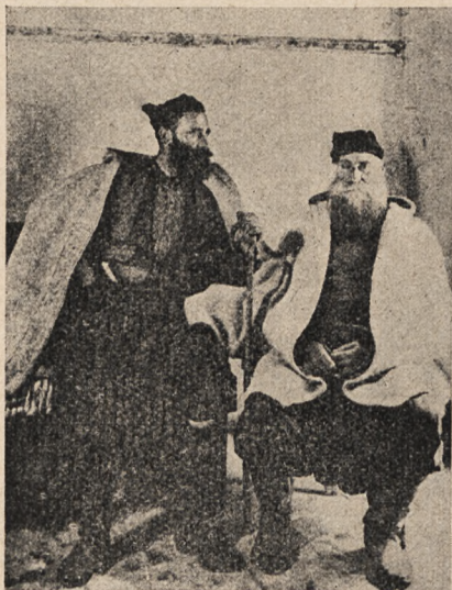
Typy wieśniaków greckich.