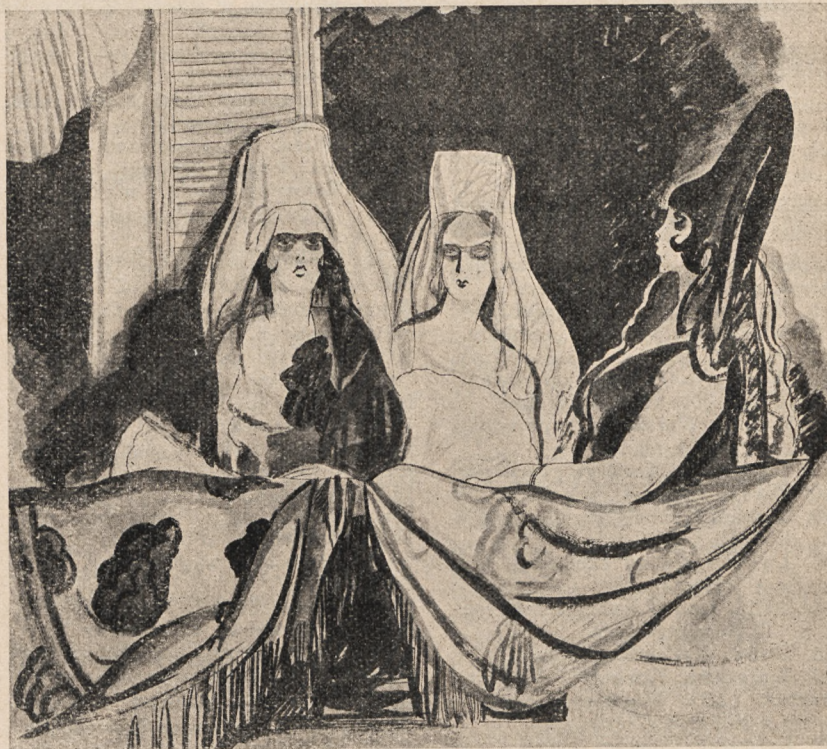
albo też, ziewając, siedzieli na tarasach...!

Ach, i na to nie było żadnej rady. Tłusta, dziewicza ziemia Uluguayu ro-