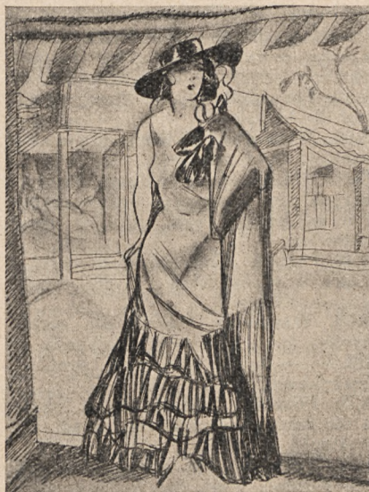
W Uluguayu panowała pustka i nuda.

Ale vendetta wszystko obracała w perzynę. Kraj się przerażająco wyludniał.