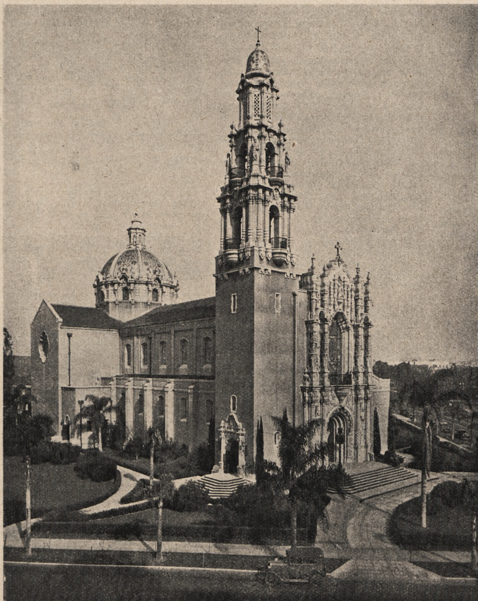
Kościół św. Wincentego w Los Angeles (Kalifornia) które w tych dniach nawiedziło katastrofalne trzęsienie ziemi.