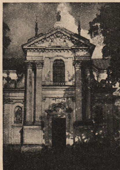
Fronton kościoła na Bielana.