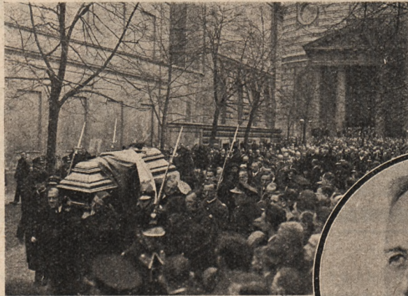
W Wielką Sobotę odbył się pogrzeb zmarłego niemal nagle Ministra Poczt i Telegrafów ś. p. inż. pułk. Ignacego Boernerę. Po nabożeństwie żałobnym, obecny w kościele Pan Prezydent Rzplitej udekorował trumnę wielką wstęgą orderu „Polonia Restituta“.

Koncert europejski fiński poświęcony twórczości słynnego kompozytora Jana Sibeliusa, będzie miłą okazją do zapoznania się szerszymi masami radjosluchaczy z muzyką fińską, do u-