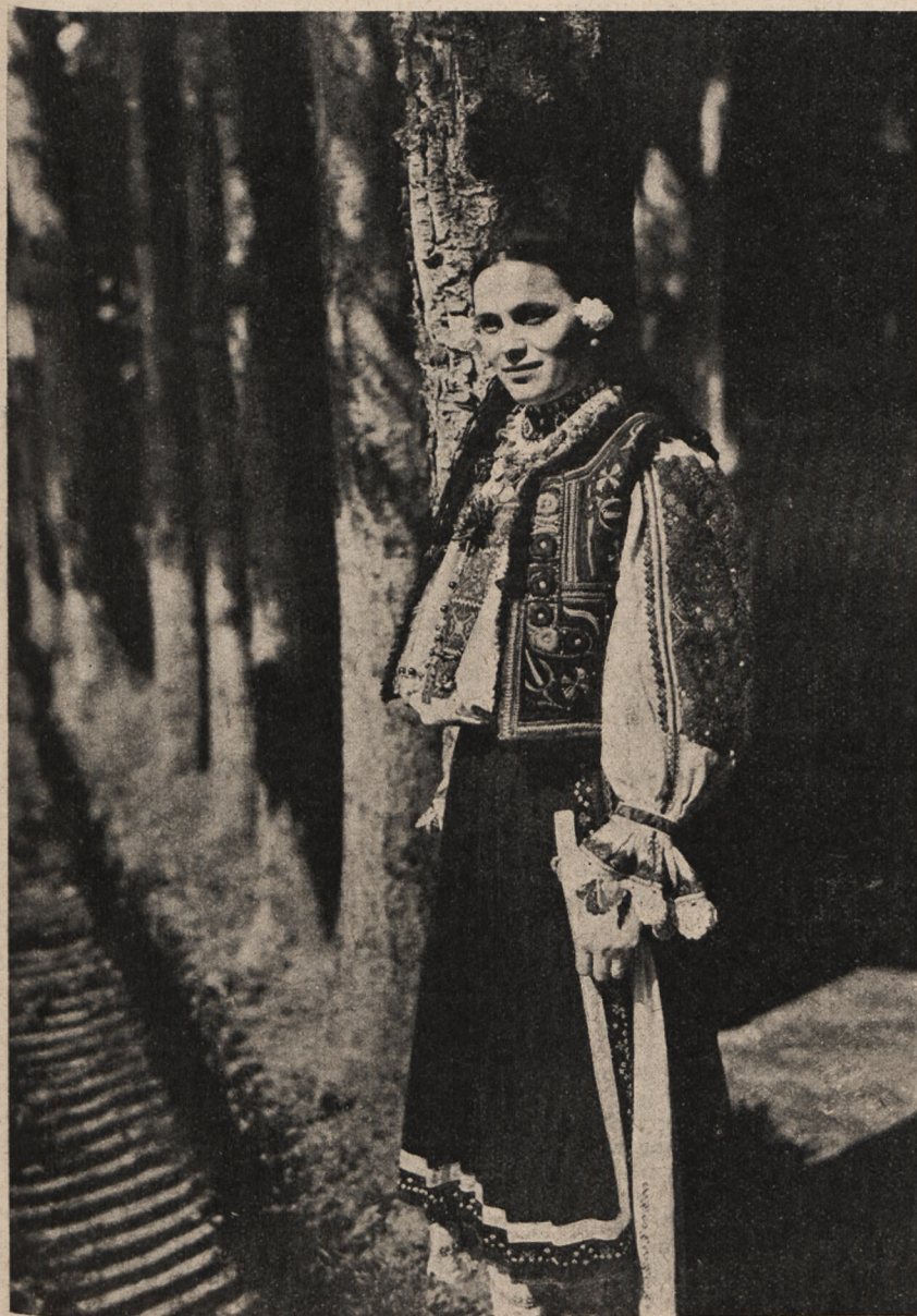
Wieśniaczka z okolic Siedmiogrodu