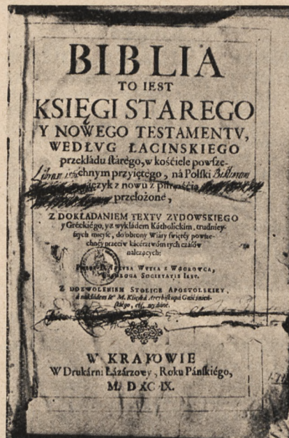
Strona tytułowa pierwszego wydania Biblii w tłumaczeniu ks. Jakóba Wujka z Wągrówca.