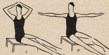
Fig. 10. Siad rozkroczny na krześle ramiona w łuk — i skręty tułowia w lewo i prawo z wyprostem ramion w bok.