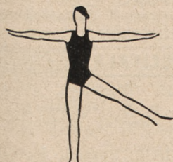
Fig. 8. Stojąc na jednej nodze, druga noga w bok i ramiona w bok.