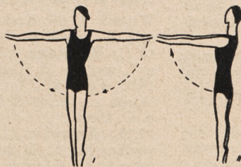
Fig. 3. Ramiona w bok — i wymachy ramion dołem wprzód ze wspięciem — i dołem w bok.