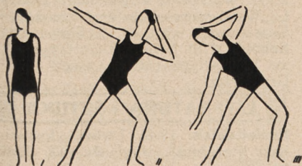
Fig. 5. W wypadzie lewą nogą, prawa noga wyprostowana, prawe ramię wzniesione w bok, lewa spoczywa na głowie — i skłony boczne na nogę wyprostowaną.