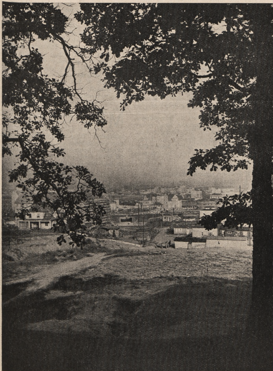
OGÓLNY WIDOK GDYNI

Programy na tydzień od 18/VI do 24/VI | Cena numeru bez przesyłki gr. 25