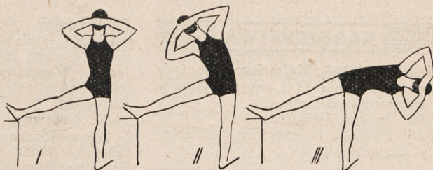
Fig. 39. W rozkroku wyparcie jedno nogi, chwyt karku — i skłony boczne.