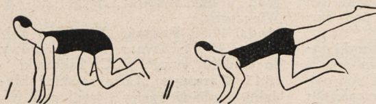
Fig. 40. Kłęk rozkroczny w podporze, uginanie i wyprost ramion ze wzniesieniem nogi w tył naprzemian.