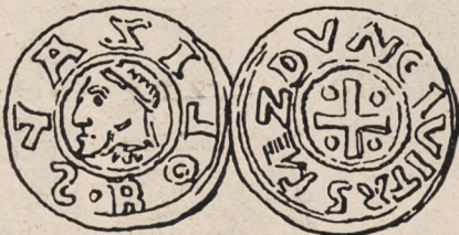
Denar Bolesława Chrobrego.

alne za czasów Chrobrego nie stracił dziś nic ze swej żywotności, historja zaś naszych stosunków z Niemcami jest dziś niemal identyczna jak wtedy, za czasów Chrobrego.