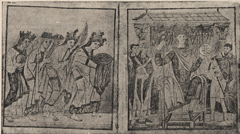
Otto III w majestacie. Składają mu hold: Rzym, Germanja, Galja, Słowiańszczyzna.

Dziś Turcja jest w znacznej lepszej pod każdym względem sytuacji niż przed wojną, rozwój zaś kraju po-