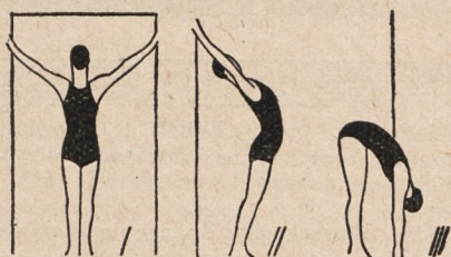
Fig. 43. Ramiona wwyż, chwyt za framugę drzwi i skłony wtył, poczem skłony wdół.