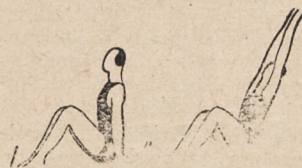
Fig. 45. Siad o nogach skruczonych lub skrzyżowanych, dłonie na ziemi i przenosy ramion wwyż z kłasnieniem ponad głową i skłonem głowy wtył.