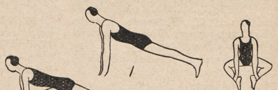
Fig. 47. Przysiad z chwy- tem za kostki od tyłu i skoki wprzód.