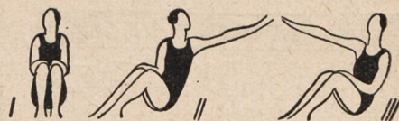
Fig. 44. Siad o nogach skruczonych lub skrzyżowa- nych, ręce na kolanach i skręty tułowia wle- wo i wprawo z zamachem odpowiedniego ra- mienia i przesunięciem drugiego ramienia na kolano przeciwne.