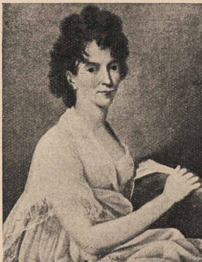
Żona Mozarta p/g portretu von Hansena.