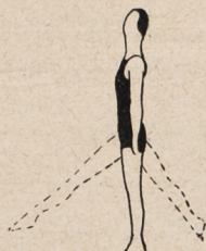
Fig. 48. Marsz po złączeniach podłogi z zamkniętymi oczami z zamachem nogi wtył, wprzód, wtył, wprzód.