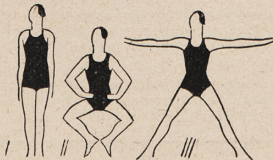
Fig. 50. Półprzysiad, ręce na biodrach z podskokami rozkroki z wymachem ramion w bok.