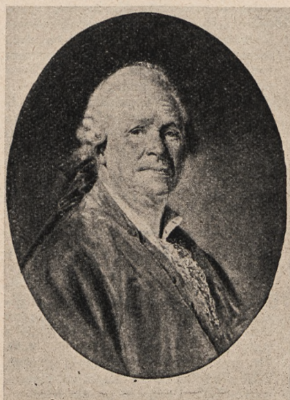
Christophe Willibald Gluck, z obrazu Greuze'a.

łączki i cierpienia budującego własny dom”, wygl. inż.-arch. H. Rutkowski. 18.35. Muzyka w wyk. ork. Savoy Hotel na płytach gram. 18.50. Rozmaitości.