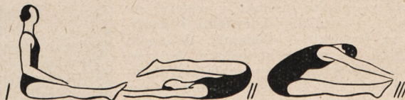
Fig. 49. Siad płaski, potem leżenie tyłem, nakrycie się nogami, ramiona w bok, lub wzdłuż głowy, potem siad płaski i skłon wprzód, ramiona wprzód.