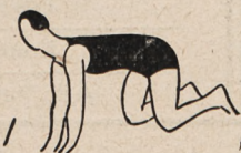
Fig. 52. Rozkłąk, podpór opadny i uginanie i wyprosty ramion z wznosem nogi wtył.