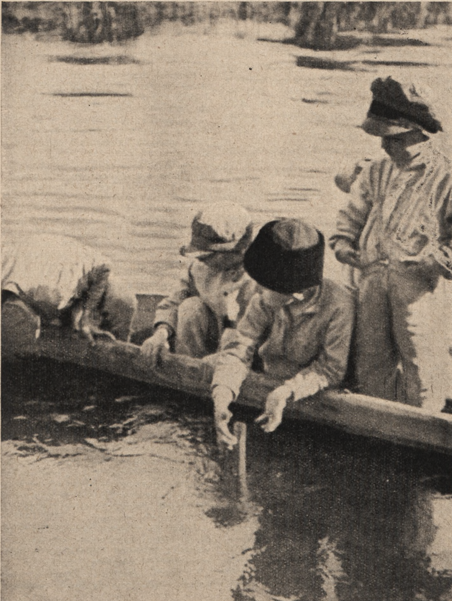
Mali rybacy na wodach

P rogramy na tydzień od 6/VII do 12/VIII | C ena numeru bez przesyłki gr. 25