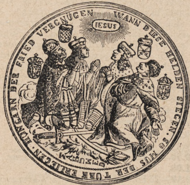
Medal pamiątkowy wybitny na cześć odscieży Wiednia z podobizną króla Sobieskiego.