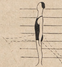
Fig. 69. Stanie bokiem do przyrządu, wsparcie ręką i wymachy no- gami wprzód i wtył naprze- mian.