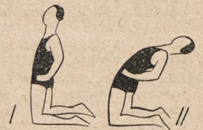
Fig. 70. Rozkłek, ramiona na biodrach i skłon wtył.

Powtórzenie figur z lekcji 10 i 11: fig. 58, 60, 61 i 62.