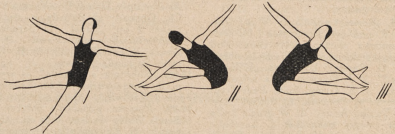
Fig. 67. Siad rozkroczny i ramiona w bok, i skrzyły tułowia w lewo i w prawo z dotknięciem palcami rąk stopy przeciwnej.