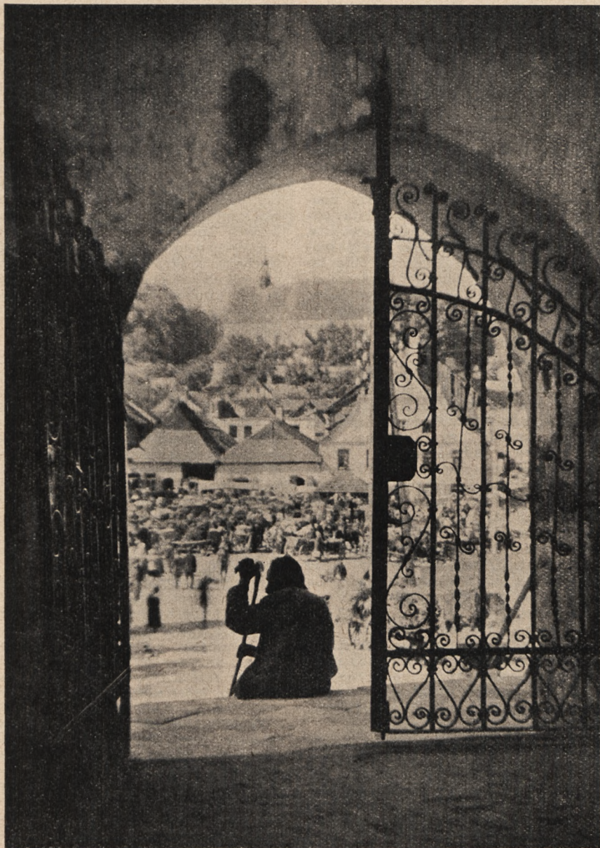
TARGI W KAZIMIERZU n/WISŁĄ.