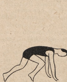
Fig. 68. Marsz na czworakach.