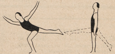
Fig. 66. Marsz po złączeniach podłogi, po 3-im kro- ku wymach nogi wtył, wprzód, wtył i waga.