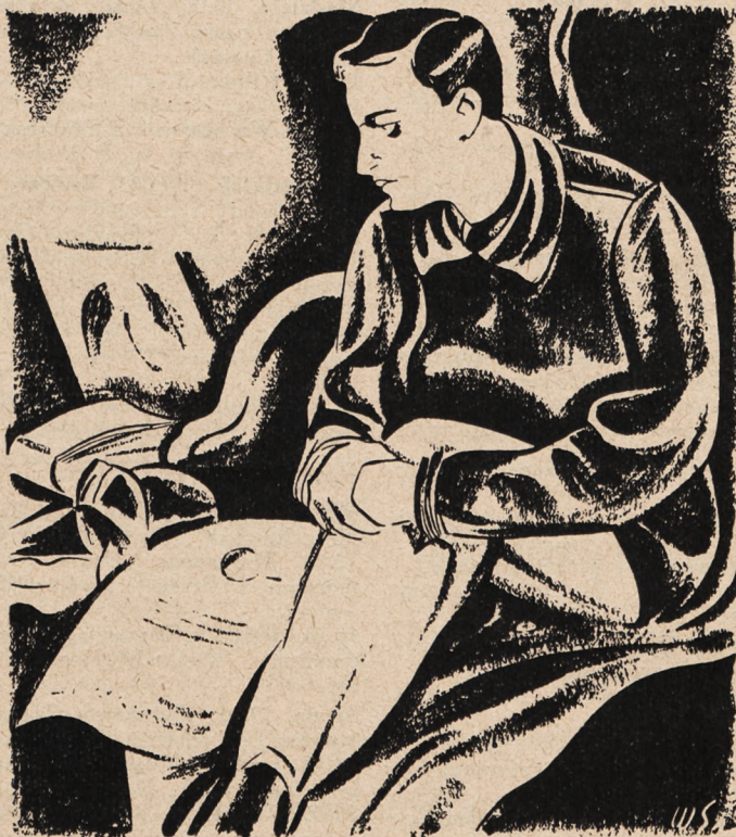
Był na to zupełnie przygotowany...

maszynę na plecy, opisując powolny luk srebrnymi skrzydłami.