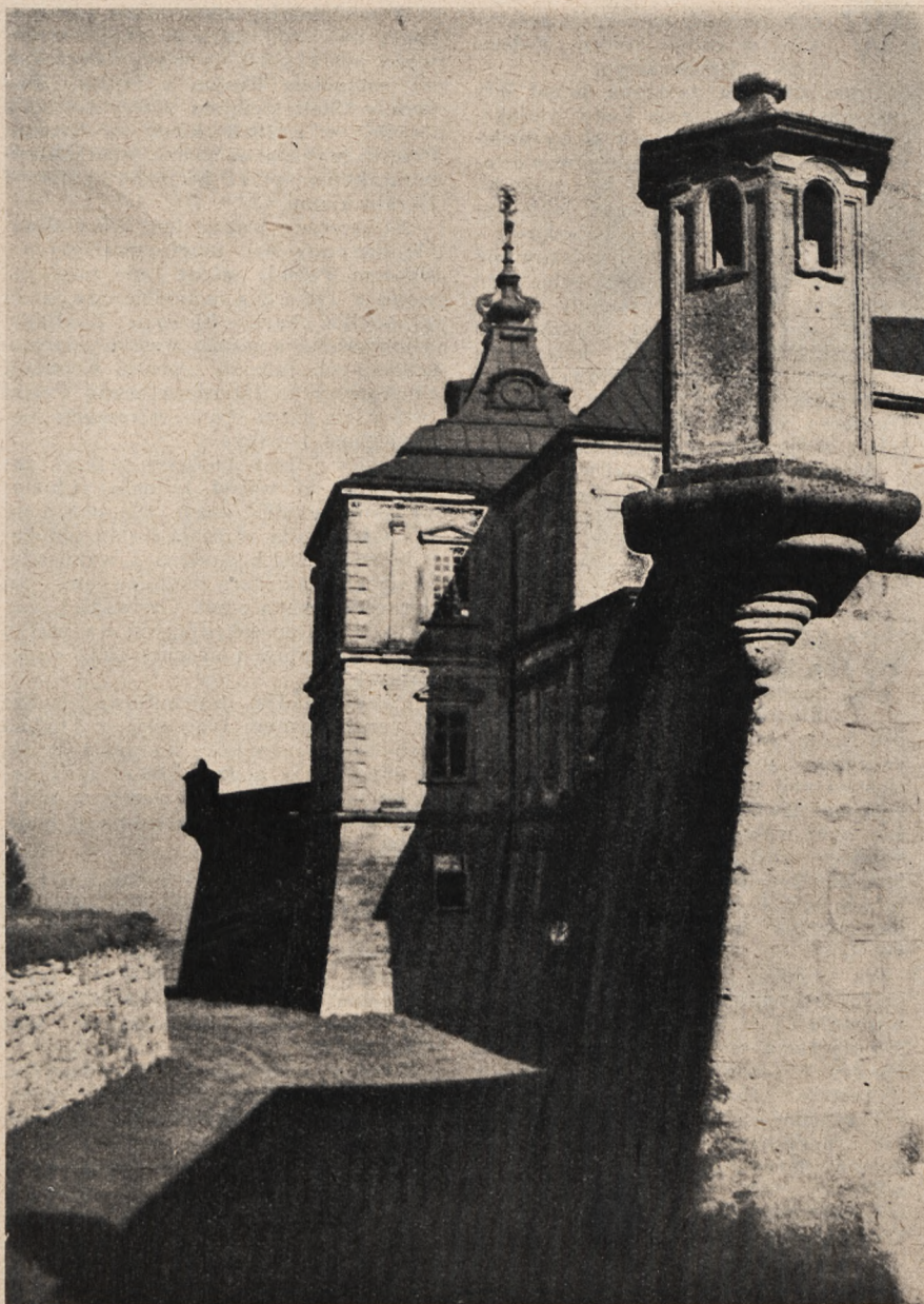
Fragment zamku w Podhorcach. Miejsce w którym spędził młodość król Jan Sobieski.

Programy na tydzień od 3/IX do 9/IX | Cena numeru bez przesyłki gr. 25