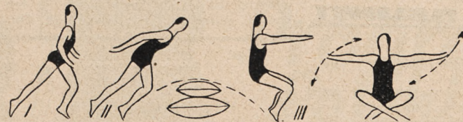
Fig. 71. Z rozbiegu 3-ch kroków skok wprzód ponad 2-ma poduszczkami.