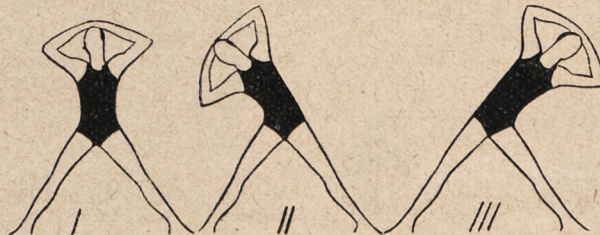
Fig. 74. Rozkrok szeroki, ręce na głowie i skłony wlewo i wpravo.