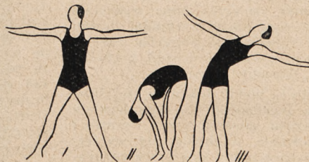
Fig. 76. Rozkrok, ramiona w bok i skłon wdół z chwytem za kostki, potem wyprost i skłon wtył.

Powtórzenie figur z lekcji 12-j: fig. 67, 69, 70.