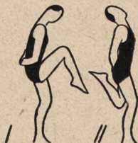
Fig. 75. Podskokami, ze skurczem nóg naprzemian. skłony głowy wtył i wprzód.