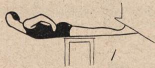
Fig. 93. Leżenie na stołku, nogi opierają się o parapet okna, skłony tułowia wdoł i wyprosty.