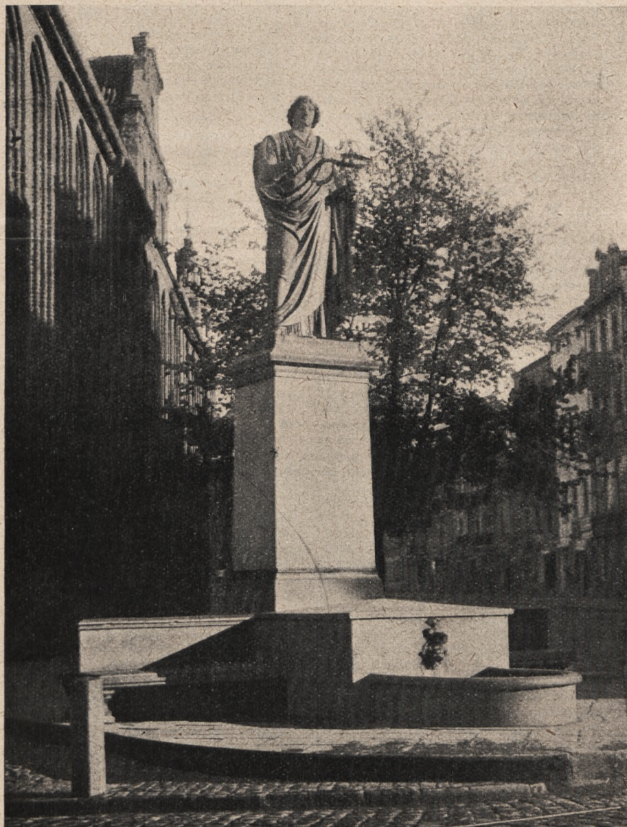
POMNIK KOPERNIKA STOI NA RYNKU W TORU- NIU, NA TLE PIĘKNEGO, GOTYCKIEGO RATUSZA.

Programy na tydzień od 1/X do 7/X | Cena numeru bez przesyłki gr. 25