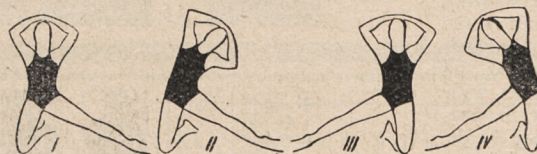
Fig. 111. Kłęk na jednym kolanie, druga noga w bok, ręce na głowie i skłony w bok na nogę wyprostowaną.