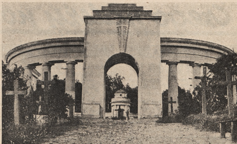
Cmentarz obrońców Lwowa.

Statystyka, jaką prowadzi radiofonja francuska, wykazała ostatnio bardzo ciekawe zestawienia. Okazuje się, że na 1.173.817 abonentów istnieje tylko 40.952 aparatów detektorowych. Reszta to aparaty lampowe, a więc pokrywające swym zasięgiem odbiorczym nie tylko Francję, ale i inne kraje. Jest to jeden jeszcze dowód na możliwość społeczeństwa francuskiego, która uwidoczniła się już niejednokrotnie, a ostatnio nawet znalazła swe potwierdzenie i w dziedzinie radiofonji.