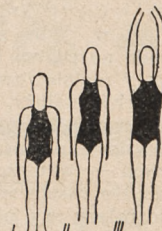
Fig. 112. 1 podskok zwykły i 4 z kłasińcem ponad głową.

18.00. Transm. nabożeństwa z kaplicy w Ostrej Bramie w Wilnie, na całą Polskę.