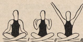
Fig. 110. Ślad skrzyżny, ręce na kolanach, poczem skurcze i wyprost ramion wraz ze skłonem głowy w tył.