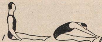
Fig. 130. Słab płaski i skłon wprzód z dotknięciem stóp palcami rąk.