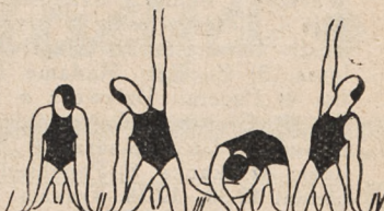
Fig. 134. Rozkłek podparty i skrety tułowia z wymachem ramion.