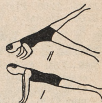
Fig. 132. Leżenie przodem, uginanie i wyprostowanie rąk ze wznosem nóg naprzemian.

LEKCJA DWUDZIESTA PIĄTA pod kierunkiem kpt. Wł. Dobrowskiego