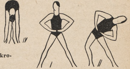
Fig. 145. W szerokim rozkroku, ramiona na biodrach i skłony tułowia wlewo i wprawy z ugięciem odpowiedniej nogi.