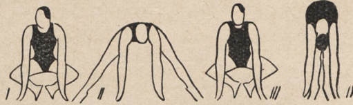
Fig. 143. Przysiad podparty z podskokami, rozkroki i wyprosty nóg w kolanach.