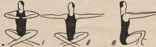
Fig. 144. Ślad skrzyżny, ramiona skurczone przed pierśią i wyprosty ramion w bok z przemieszczeniem w przód.