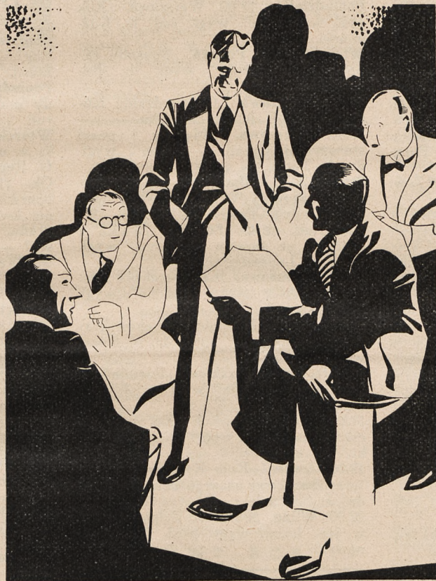
W gabinecie toczyła się wielka narada.