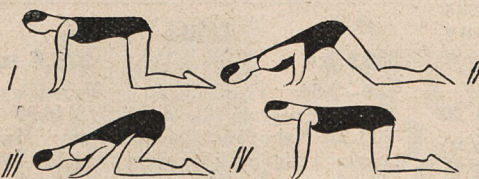
Fig. 147. Rozkłąk podparty — przenoszenie ciężaru ciała do przodu i do tyłu.