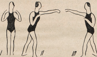
Fig. 149. W rozkroku — ramiona skurczone — i skrety tułowia z wyprostowanym ramieniem wprzód naprzemian.