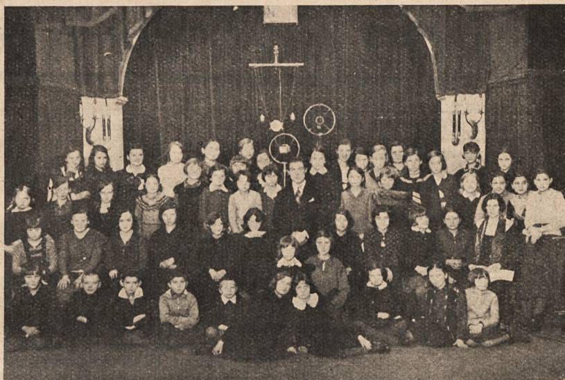
Zespół chórалny (warszawska szkoła powszechna Nr. 52) występujący przed mikrofonem rozgłośni warszawskiej w ramach audycji dziecięcych.

W sferze marzeń obraca się jeszcze widzenie przeszłości, skonstruowane w jakimś fantastycznym pomysle powie-