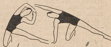
Fig. 181. W klęku podpartym jednońó skłony tułowia na nogę wyprostowaną.