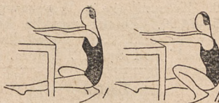
Fig. 179. W przysiadzie przodem zmiana nóg podskokami.