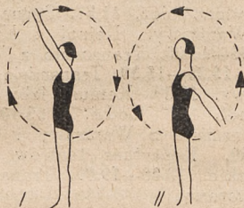
Fig. 180. Krażenie ramion.