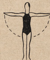
Fig. 15. Miękkie wznoszenie ramion wbok.

R ozgłośnią wileńska w roku bieżącym i w poprzednich latach, w okresie wielkopostnym organizuje rekoлекcje. Do r. 1932 prowadził reko-