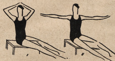
Fig. 14. Siad rozkroczny na krześle, dłonie na głowie i skrety tułowia wlewo i wprawo z wyprostem ramion wbok.