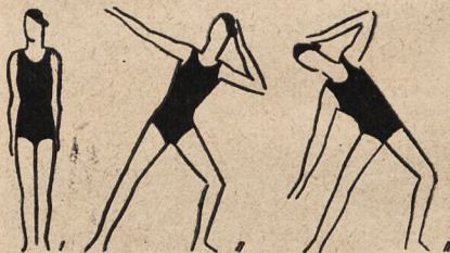
Fig. 13. W rozkroku jedna noga zgięta, jedno ramię wbok, a drugie dłonią wsparte na głowie — i skłony boczne na nogę wyprostowaną.