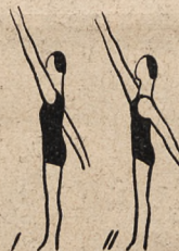
Fig. 11. W rozkroku — naprzemianstronny wymach ramion wprzód i wtył.