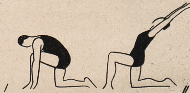
Fig. 17. Kłęk na jednym kolanie i bezwładny skłon w dół, poczem zamachem ramion wzwyż skłon w tył.