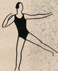
Fig. 20. Podskoki na jednej nodze — jedno ramię kark, drugie ramię i noga w bok naprzemian.