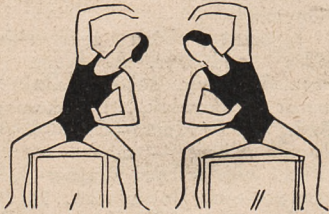
Fig. 23. Siad rozkroczny na krześle — jedno ramię w bok, drugie biodro — i skłony w bok z zamachem odpowiedniego ramienia.