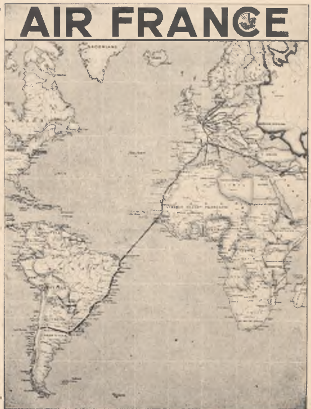
Trasa linii lotniczej z Europy do Ameryki Południowej.

Tow. francuskich linii lotniczych „Air France“ zwraca uwagę za, interesowanych, że przyjmuje do przewozu, oprócz listów zwykłych, poleconych, ekspresowych i z opłaconą odpowiedzialnością, które podlegają normalnym opłatom lotniczym, również druki, próbki towarów, przesyłki mieszane i t. d. papiery handlowe, t. zw. akta sądowe, rachunki, pokwitowania, listy przewozowe, konosamenty, polisy ubezpieczeniowe i t. p. dokumenty, które korzystają ze zmniejszonej taryfy. Na wszelkich przesyłkach, przeznaczonych do Ameryki Południowej, do przewozu via „Air France“, winien być zamieszczony napis lub naklejona nalepka: „Par avion Air France“.