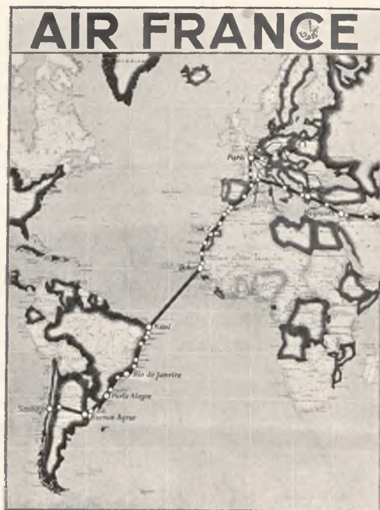
Trasa linii lotniczej „Air France“ z Europy do Ameryki Południowej.

Poczta lotnicza do Ameryki Południowej. Towarzystwo francuskich linii lotniczych „Air France“ zwraca uwagę zainteresowanych, że przyjmuje do przewozu, oprócz listów zwykłych, poleconych, ekspresowych i z opłaconą odpowiedzią, które podlegają normalnym opłatom lotniczym, również druki, próbki towarów, przesyłki mieszane i t. zw. papiery handlowe, t. zn. akta