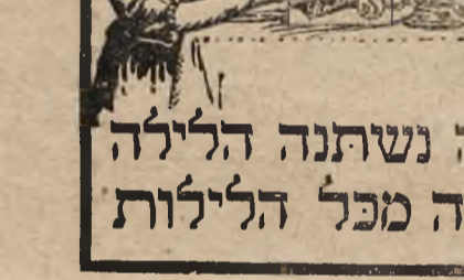
מה נשתנה הלילה הזה מכל הלילות

נא-שטמער און געלבוכט רעגולירט די פערדאונג דאס נאטורליכע ביטער האמער Franciszka Józefa