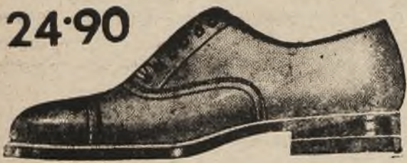
פאסאָן 9977-27 שוואַרצע און געשניטע שיד פון ערשטקלאַסיגען פאַקס אויף א פּעסטער לעדערער פאַדעשווע.