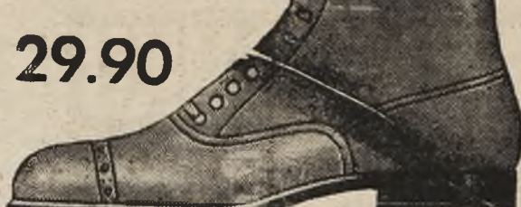
פאסאָן 9937-18 מענער-לאַטשען פון שוואַרצען פאַקס אויף א פּעסטע פאַדעשווע, בעקוועמע און זעהר רייערהאַפּט.