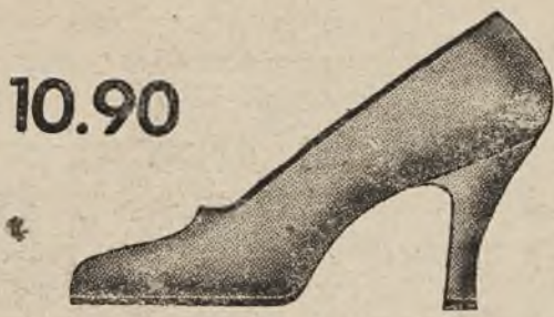
פאסאָן 9815-03 עלעגאַנטער און זעהר ביליגער לאַטש פון שוואַרצען סאַמעט, הויכער טיפּליכער אַבזאַס.