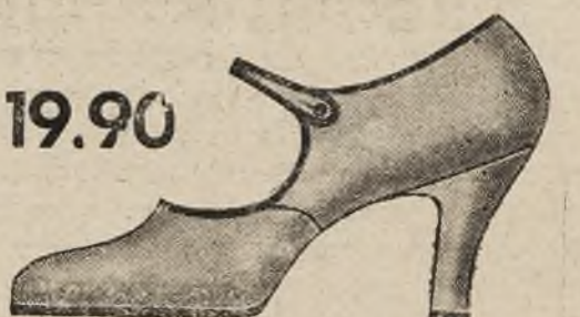
פאסאָן 9875-01 עלעגאַנטער שוואַרצער לאַקירטער פאַנטאַסעל, אויף אַ הויכן אַבזאַס, ענטפּרעכענד צום טאַג און הייזטען