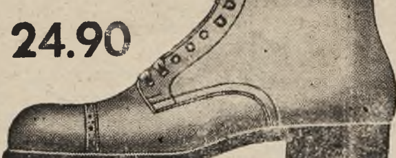
פאסאָן 3967-22 אויף א שלעכט וועטער די שיד פון שוואַרצען פאַקס-לעדער אויף א פּעסטער גומענער פאַדעשווע