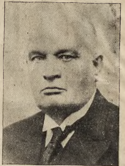
Estijos prezidentas Paetsas

Tačiau santykiai pradėjo kitėti ir blogėti, kai Hitleris tapo Vokietijos kancleriu ir vadu. Tada, kaip ir kitose valstybėse, Čekoslovakijos vokiečių tarpe ėmė plisti nacionalizmas, kuris augo kaip ant mielių. Kitos, senosios vokiečių partijos ėmė silpnėti, tirpti. Kartu prasidėjo tarp vokiečių mažumos