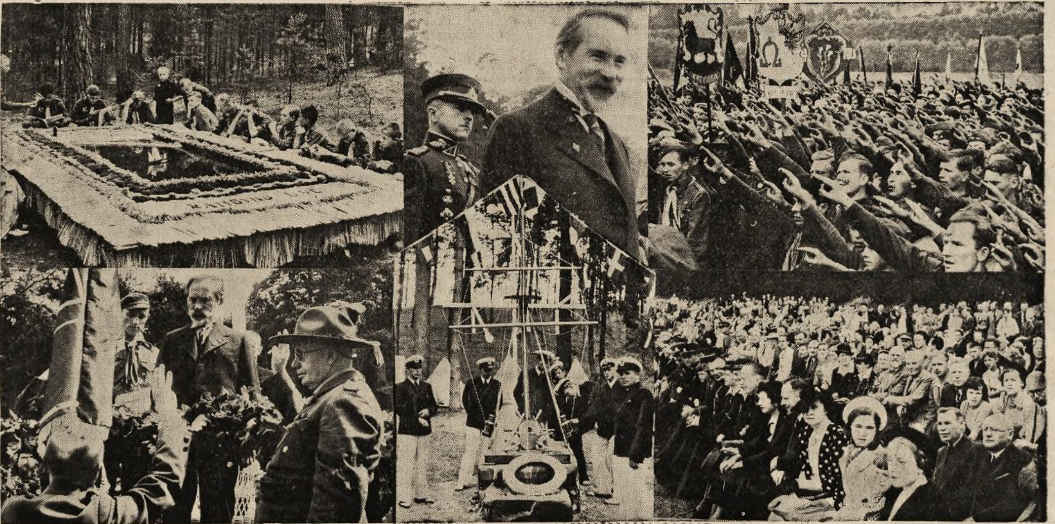
Ši nuotrauka vaizduoja Lietuvos skautų II tautinės stovyklos atidarymą: (aukštai iš dešinės) Lietuvos skautai didžiuoju saliotu sveikina savo Šefą Valstybės Prezidentą Antaną Smetoną, (aukštai viduryje) Lietuvos skautų Šefas Valstybės Prezidentas Antanas Smetona, greta jo e. krašto apsaugos ministerio p. kariuomenės vadas brig. gen. St. Raštikis, (aukštai kairėje) Klaipėdos krašto Pagėgių „Rambyno“ skautų draugovė, (apačioje kairėje) Lietuvos skautų Šefas Valstybės Prezidentas Antanas Smetona iškilmingai įteikia Lietuvos skautams vėliavą, (apačioje viduryje) Klaipėdos miesto jūrų skautai ir apačioje (dešinėje) stovyklos atidaryme gausiai dalyvavę svečiai.

Lietuvos skautai atsirado 1918 metais. Jie pradėjo organizuotis Vilniuje. Taigi dabar jų organizacija jau turi 20 metų.