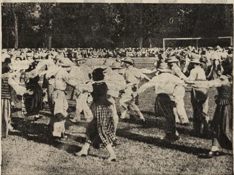
Tautiški lietuvių šokiai Pirmoje Tautinėje Lietuvos Sporto Olimpiadoje.

Svarbiausia susitarimo vieta yra toji, kur kalbama apie dėsimoją kalbą. Taigi pagal susitarimą Latvijos mokyklose dėstomoji kalba bus lietuvių kalba ir Lietuvos mokyklose — latvių kalba,