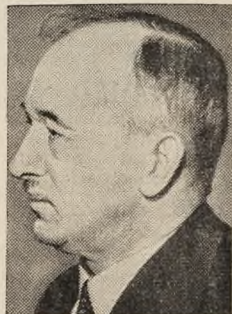
Čekoslovakijos Prezidentas EDVARDAS BENEŠAS

jokio atlyginimo. Šitaip apkarpyta Čekoslovakija turės didelių ūkio sunkenybių. Vokietija beveik paims visas Čekoslovakijos anglų kasyklas, o taip pat didelę dalį geležies rūdos kasyklų. Vokietijai taip pat atiteks didelė tekstilės pramonės dalis. Taip pat čekai neteks ir didelių chemijos fabriku, kurie yra pastatyti čekoslovakų ištekliais. Be to, prijungus Sudetų prie Vokietijos, Čekoslovakija nustos visos eilės stiklo ir kitų fabriku.