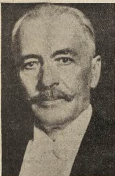
Lenkijos Prezidentas PROF. I. MOSCICKIS

Šiame lapkričio 11 dieną Lenkijoje buvo ypač iškilingai paminėta, nes tą dieną suėjo 20 metų, kai iš Magdeburgo sugrįžo J. Pilsudskis, kuriam jau kitą dieną buvo atiduota visa naujai atstatomos Lenkijos valdžia.