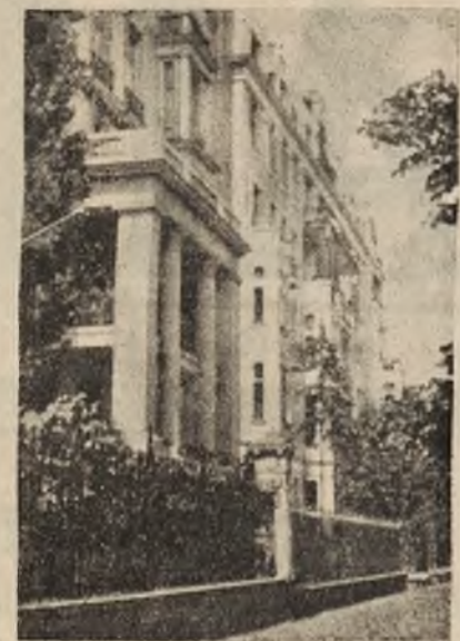
Šiuose namuose gyvena Lietuvos Pasiuntinys Varšuvoje ir čia yra Pasiuntinybės reprezentacinis butas.

Pastaba. Nešališkumo dėliai tenka suminėti paskutiniu metu spaudoje pasirodžiusiu šiuo klausimu ir kitokios žinios. Būtent, pranešama, kad „Słowo“ korespondento pranešimas apie piliečių padalinimą į tris kategorijas neatitinkas tikrovę. Girdi, įvairius įstatymų projektus galys ruošti tik Seimo ozono klubas, o ne ozono centralė. Atitaisyimas ne visiškai aiškus, nes griežtai nepaneigta tokių žinių tikrumo; taip pat nieko daugiau neprisitarė šiuo klausimu ir „Słowo“.