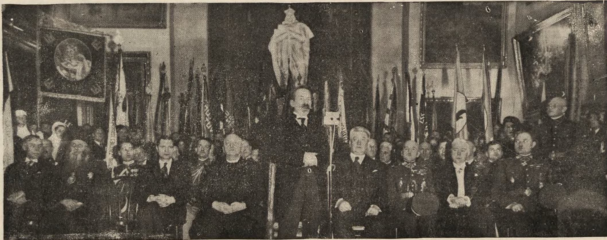
Vasario 16 dieną įvykęs iškilmingas posėdis Karo Muziejuje. Kalba Lietuvos Prezidentas Antanas Smetona. Nuo jo į kairę ministras pirmininkas Vl. Mironas, finansų ministras Indriūnas, vysk. Bučys ir Lietuvos Banko valdytojas J. Tūbelis. Dešinėje — Seimo pirmininkas K. Sakemis, kariuomenės vadas brig. gen. Raštikis, teisingumo ministras Gudauskis ir kariuomenės štabo viršininkas brig. gen. Černius.