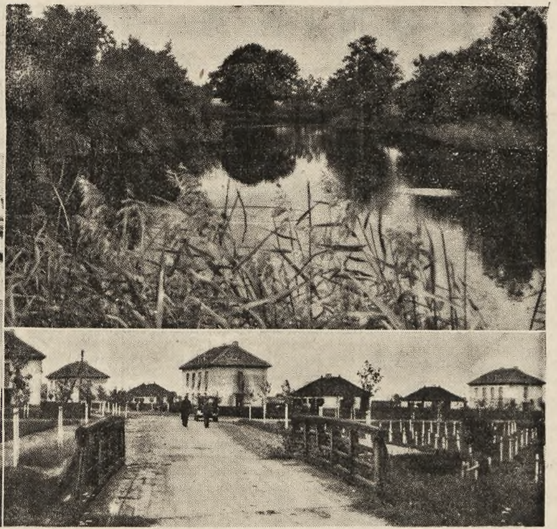
Šventosios uosto (Lietuvoje) vaizdai: viršuje uostui dirbamas molas; dešinėje — Šventoji, apačioje kairėje uosto mokykla, dešinėje — Šventosios uosto naujoji statyba.

jei bent uždirba savo ir savo šeimos narių gyvybės palaikymui. Dėl to reikia, galvoju, nieko nelaukiant, stengtis Lietuvoje sudaryti specialų fondą padėti grįžti bent daliai tokių žmonių.