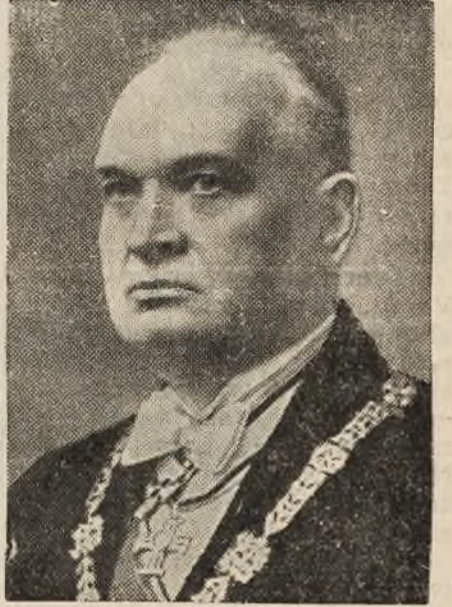
Dabartinis Estijos prezidentas PAETS

Panašiai rašo ir italų laikraščiai, pažymėdami, kad Anglijos, Prancūzijos ir Amerikos ginklavimasis turi nepaprastai didelės tarptautinės reikšmės. Ta pačia proga italų laikraščiai atrodo patenkinti, kad angliai daugiau jau nekalba apie Tautų Sąjungą ir, kad Čemberlenas kitokiu būdu stengiasi praskaidrinti Europos atmosferą. Girdi, Hitleris ir Musolinis tai mėginę daryti daug anksčiau.