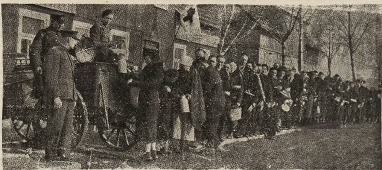
Klaipėdos krašto pabėgėliai Kretingos mieste maitinami iš kareiviškų virtuvų. Maistą teikia Lietuvos Raud. Kryžius.

Nėra reikalo įrodinėti, kad smūgis Lietuvos ūkio gyvenimui yra be galo didelis. Tikėkimės, kad Lietuva, remdamasi savo sveika ekonomine struktūra, ir šį smūgį pergyvens. Turėkime vilties, kad visa lietuvių tauta ryžtingai ir vieningai parems vyriausybės pastangas lygsvarai atstatyti ir Lietuvai atsilaikys prieš pavojus, kurių yra kupina dabartinė gaidynė.