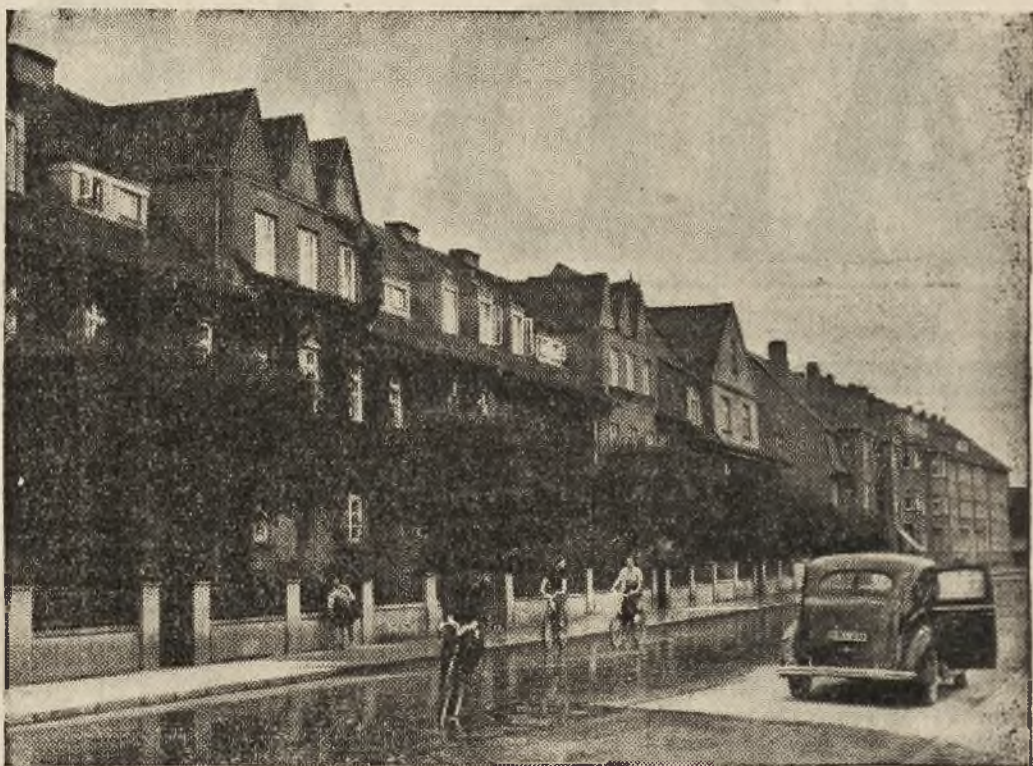
Kanto gatvės tipingi namai — Klaipėdoje.

Žinoma, leidimas be nuomos mokesčio pasinaudoti tam tikra uosto zona mažai tepalengvina smūgį Lietuvos ekonominiam gyvenimui. Atrodo, kad Lietuva negalės apseiti be uosto, kuriame ji būtų šeimininkas. Lietuvai reiks sukaupti jėgas naujam uostui šventojų pasistatyti. Tai pareikalaus energijos ir lėšų, bet nieko nepadarysi — reiks mums pasitempti, reiks atsakyti šio ir to, stambių algų ir ilgų priedų, reiks vieningo ir plataus lietuviškų jėgų žygio. Pradedamuoju mastu tegul bus čia reali pradžia į tautinę Lietuvos valstybę, kurioje sutilptų ir kurią pripildytų gryna lietuvių tauta be žymesnių svetimtautiškų priemaišų“.