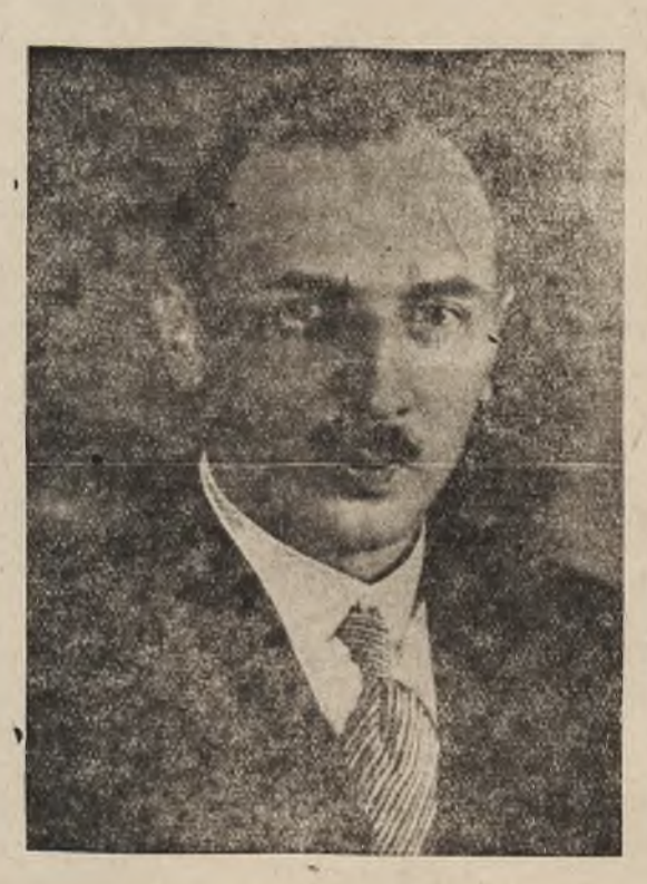
מיניסטער יעושי פאטשאַרקאווסקי

טער, 4 יאהר ערפולט ער די פליכטען אלס קעלצער וואַיטוואַדע און צום סוף-מיניסטער פון געזעלשאַפטליכער שוין. די פאמיליע פון מיניסטער פאטשאַרקאווסקי שטאמט פון גרויסע לאַנד-בעזיצער, וועלכע האבען זיך מיט א סך יאהרען צוריק בעזעצט אין טשענסטאכאווער גרויסע שטחים ערד פון אונזער שטאָדט, אויף וועלכע ס'געפונען זיך היינט די גאָסען: פאָרשטאָדט, ספּאָדעק, אַגראָדאָ-ווא און אנדערע, האבען אמאל געהערט צום זיידען פון היינטיגען מיניסטער.