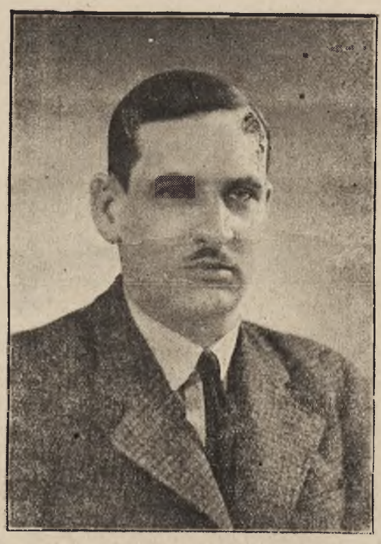
דירעקטאר וואצלאוו קאבילעצקי