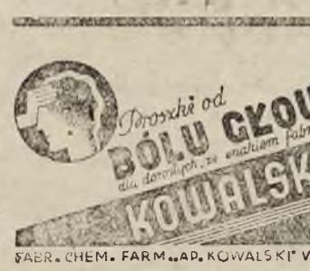
BOLE GŁOWU KOWALSKA