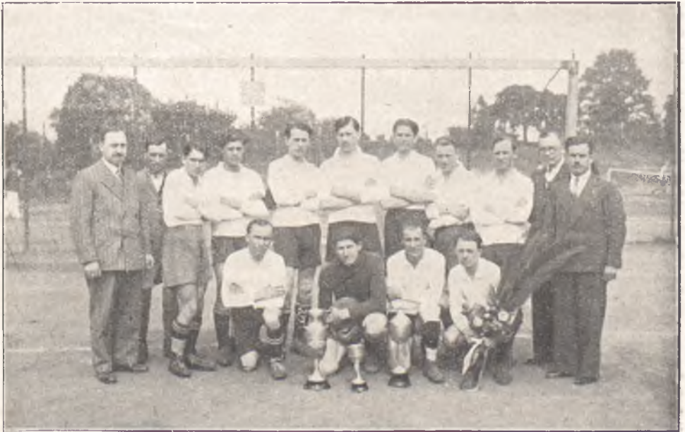
Drużyna piłkarska Oddz. Zw. Strzeleckiego w Leodjum

Drużyna ta jest dwukrotnym zwycięzcą pucharu Manteufle o wartości 5 tys. franków, bijąc najlepsze drużyny w swej kategorii m. Liège, Brukseli i Limburgii.