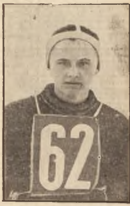
Kolego Marianie! Pamiętaj, że cała polska sportowa bracia szkolna liczy, że i w tym roku staniesz dobrą przystawką do zawodów F.I.S.

Przeprowadzona ona została podobnie jak w Krywinie. Jedyną różnicą będzie chyba cena. Wycinkiem lasu biegać jeden tor, po którym w niedalekiej przyszłości mają kursować dwa wagoniki mijające się w środku na specjalnej mijalni. Starych bywałców Kasprowego powinna ucieszyć wiadomość o wyciągu saniovym z kofa Gąsienicowego. Podczas gdy słomowłók i stary będą się obitać po zbożach kofa — stary wypryjarze znajdą niezliczoną ilość tras zjazdowych, wyciecznych przez tak nieprawdopodobne wertypy, że mniej wprawnym oko bieleje i potulnie wracają kolejką. Wyciąg na Wołowice w dolinie Czochołowskiej umożliwi stworzenie bazy wypadowej do całego szeregu pięknych wycieczek. Jazeli już mowa o Czochołowskiej, to należy wspomnieć o chodzących płotkach, jakoby projektowana była budowa pomnika ku pamięci upadłej gwiazdy, (Dokończenie na str. 2-iej).