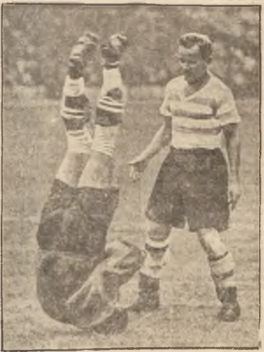
Z dołu i niedoli piłkarza.