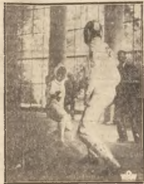
Szemierka wchodzi w skład 5-boju nowoczesnego.