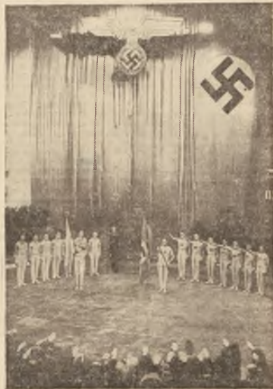
UROCYSTE OTWARCIE międzynarodowych zawodów gimnastycznych Pałaca — Nancy.