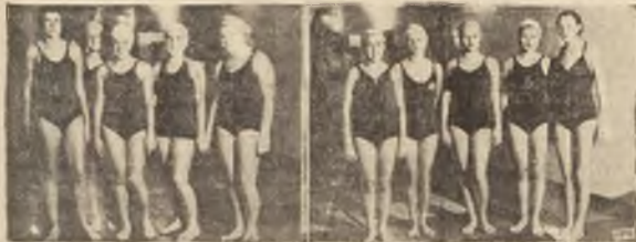
W RAMACH PEYWACKICH MISTRZOSTW męskich liceów warszawskich — szatale żeńskich gimnazjów podczas szatale licealistek