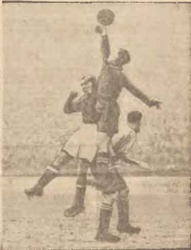
Na zdjęciu moment z meczu Preston — Portsmouth 0:1. Przedstawienie Prestonu w opresji.