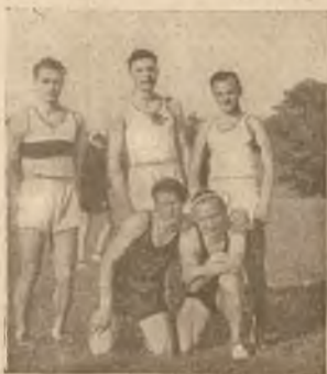
Finałowe „setki” w zawodach liceów warszawskich. Klęcza od prawej – Śluzarski – 1, Mickiewicz – 11, Chodźski – Świąt, Dyr 11,5; Staig od prawej – Korntnik 11,7, Krzyżewski – 11,7, Bednarski – 11,8.