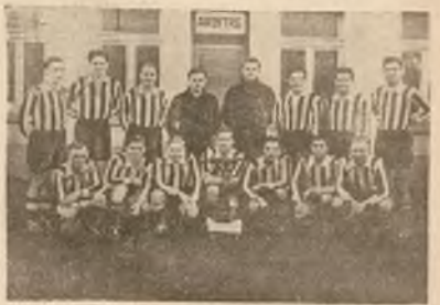
Mistrz Luksemburga u siebie...

A. S. „La Jeunesse” jest najstarszym i najpopularniejszym klubem Luksemburga, a daty jego powstania związane jest z rokiem 1907. Na drużynę tego klubu opiera się od lat, aż po dziś dotychczas reprezentacja państwa Luksemburga, w której gra 7 zawodników „La Jeunesse”. Mistrzem swego kraju jest „La Jeunesse” od roku 1897. Klub posiada najbardziej w Luksemburgu stadion, na którym może na rozgrywać mecze przy świetle reflektorów. Piłkarze „La Jeunesse” są amatorami, a jeśli chodzi o skład narodowościowy, to drużyna