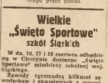
Na powyższe „Święte Sportowe” wywędza z ramienia „Spartu Szkolnego” ant. Lech Górski.