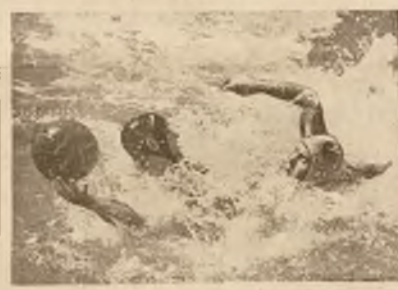
Tak się gra w waterpolo... „Jakaż