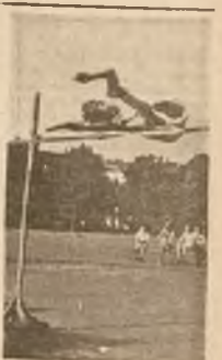
Kol. Xięgopolski — 1. Władysławina IV-go skoczył w ubiegłą sobotę na mistrzostwach szkół warszawskich 177 cm.