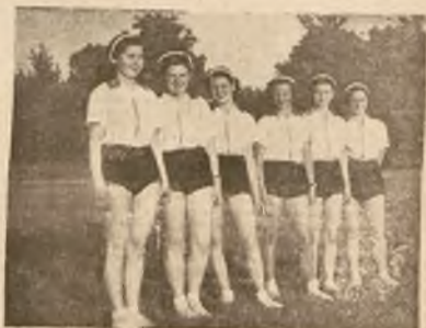
Duzyna Gimn. im. Curie-Skłodowskiej zdobyła prawdopodobnie mistrzostwo siatkówki szkół warszawskich.