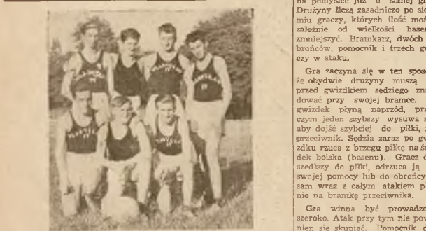
Drużyna koszykarki Gimn. im. Władysława IV, pretendēt do tytułu mistrza Warszawy.

Gra winna być prowadzona szeroko. Atak przy tym nie powinien się skupiać. Democenie dostawczy piłkę na chwilę czasu na wypatrzenie swojego gracza na