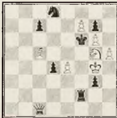
17. »Okularnik I.«