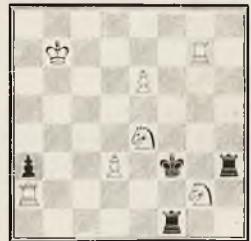
18. »Okularnik II.«