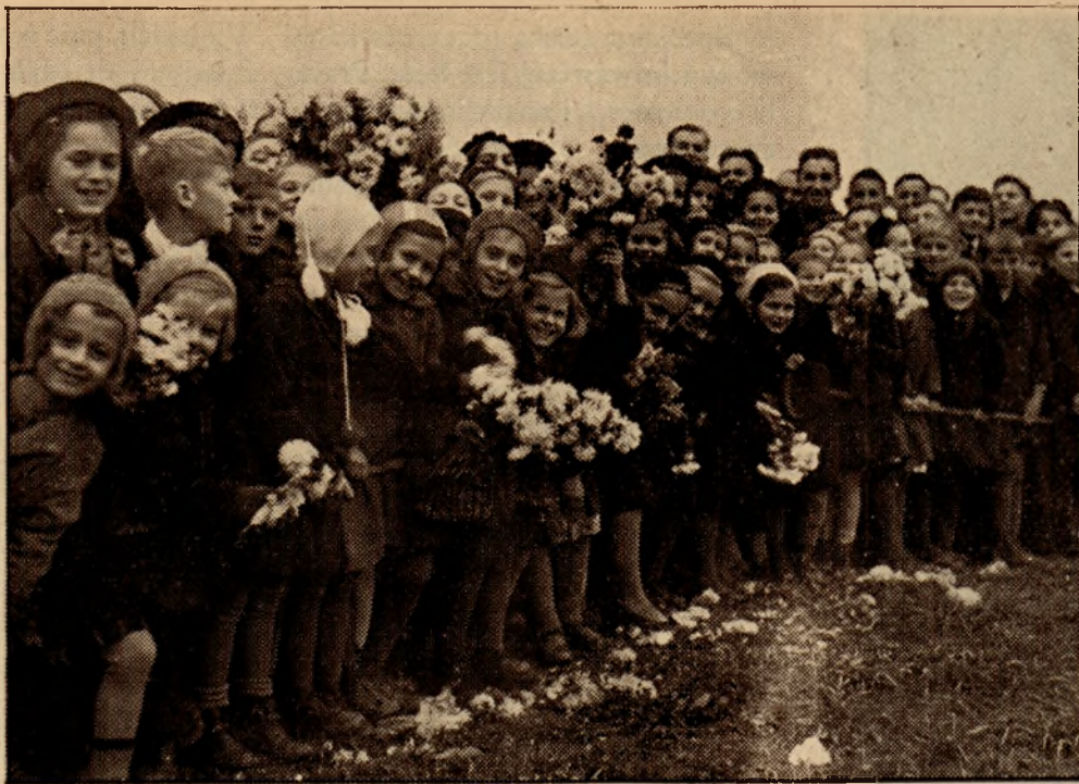
Dzieci z Cieszyna witają oddziały polskiej armii w czasie defilady.

W warunkach wiejskich sprawa ta jest specjalnie ważna ze względu na przeciążenie pracą kobiety wiejskiej matki. Prace nad zagadnieniem wychowania i opieki nad dzieckiem wiejskim podjęła Centralna Organizacja Kół Gospodyń Wiejskich ze zdwojoną energią.