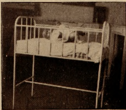
Kurs dla młodych matek (Dziecko powinno spać oddzielnie).

dyń Wiejskich pracują pielęgniarki społeczne, jako instruktorki zdrowia.