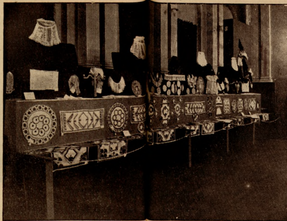
Wystawa haftu piowskich.

Lokale świetlicowe stanowią przeważnie własność międzyorganizacyjną (Kola Gospodyń, Kółka Rolniczego, Kola Młodzieży itd.).