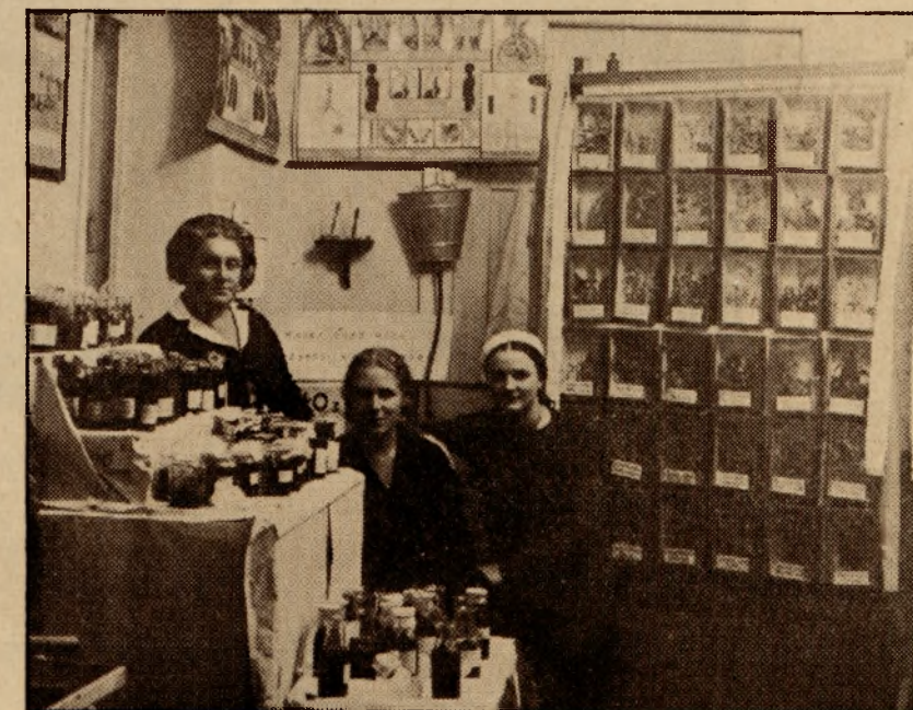
Fragment wystawy gospodarczej K. G. W. (przetwory owocowe).

Zagadnienie opieki nad dzieckiem wiejskim jako jeden z bardzo ważnych problemów wypłynęło