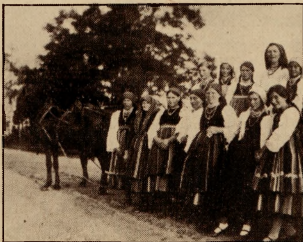
Jedziemy na wycieczkę.

dyń Wiejskich pracują pielęgniarki społeczne, jako instruktorki zdrowia.