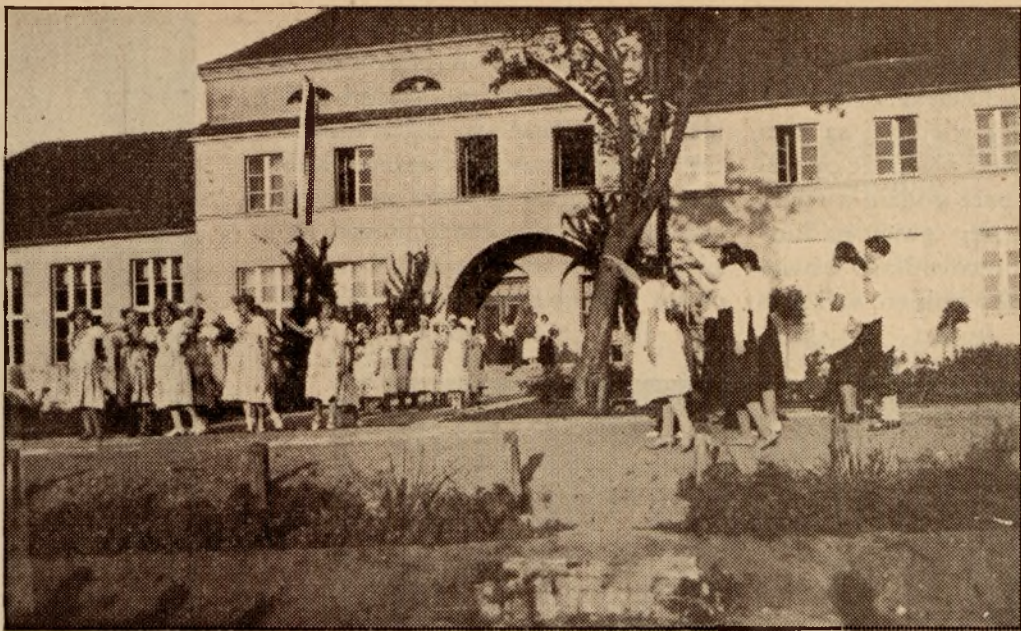
Inscenizacja w szkole rolniczej.

ły pierwszymi krajami, w których rozpoczęto pracę oświatowo-gospodarczą wśród kobiet wiejskich (w roku 1896).