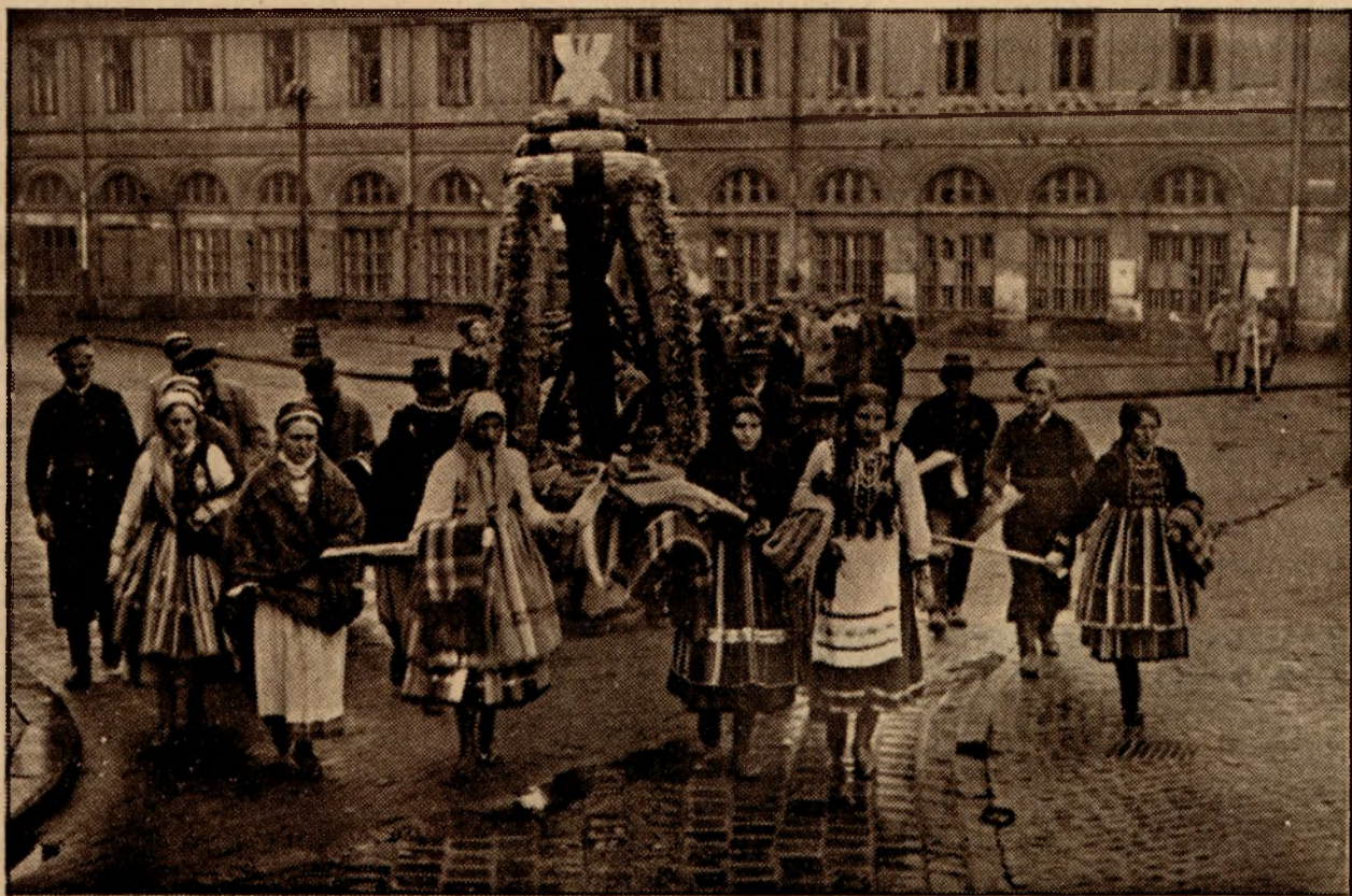
Kobiety wiejskie na uroczystościach w Warszawie.

Kierownicy dzisiejszego życia Rzeczypospolitej dążą do stworzenia z Polski państwa rolniczo-przemysłowego w miejsce państwa o nadmiarze rolników i niedowładzie przemysłu. Przebudowa struktury gospodarczej kraju oto podstawa wielkich planów gospodarczych — wicepremiera Kwiatkowskiego.