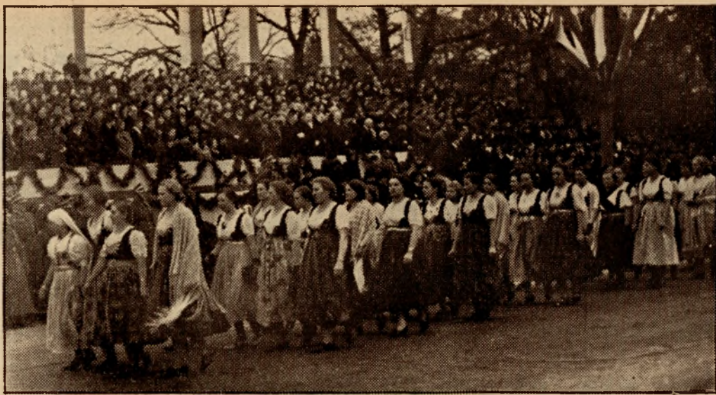
Kobiety wiejskie z Zaolzia w Warszawie.

Polski — uczestniczyć muszą wszyscy Polacy — ta podstawowa prawda została na szczęście zrozumiana a jej ważność oceniona w dniach powstania Polski Odrodzonej. Bo przecież, kiedy po odzyskaniu niepodległości zabrał się naród polski z energią do pracy na własnej ziemi, do usuwania braków we wszystkich dziedzinach życia kulturalnego, społecznego i gospodarczego, nie mogły ogromowi tej pracy podołać tylko instytucje państwowe i polska inteligencja. Na uboczu nie mógł pozostać i nie pozostał chłop, który w latach wyrąbywania drogi do wolności wykazał tyle patriotyzmu i poświęcenia.