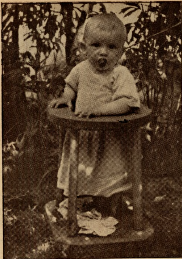
Dziecko w stojaku jest bezpieczniejsze.

Kobieta wiejska nie tylko musi zaopatrzyć swój dom w produkty nabyte w mieście czy wytworzone we własnym gospodarstwie, ale troszczyć się i o ich zbyt, a nieraz — ko i o zbyt wyrobów własnych rękoździelniczych (haftów, płótna, samodziałów). Z gospodarstwem kobiecym wiejskim wiąże się przeto ściśle zagadnienie produkcji i zbytu. Szeroki jest zakres prac gospodarczych kobiety wiejskiej i niezwyczajnie ważny.