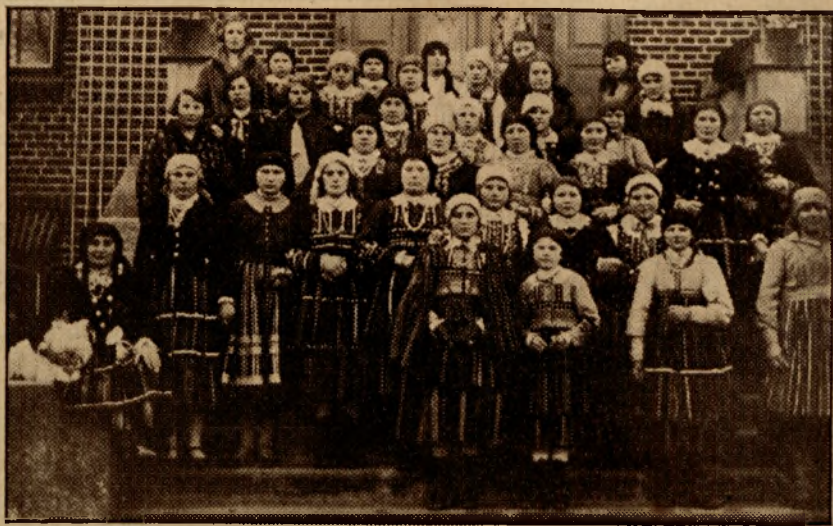
Walne zebranie K. G. W.

Przy tej żmudnej pracy nad budowaniem kulturalnej i bogatej wsi polskiej nie zapomina kobieta wiejska o swym nie mniej ważnym obowiązku przygotowania się do obrony kraju. Na kursach, z książek, w specjalnych organizacjach zdobywa niezbędne wiadomości do pracy dla wyżywienia Armii gdy ta pójdzie walczyć na granice Rzeczypospolitej i wyżywienia całego kraju, zastępując w gospodarstwach mężczyzn. Ta gotowość silnego odporu wroga daje jej nadzieję, że spokój, którego nikt więcej chyba niż kobiety-matki nie pragnie, nie zostanie jednak pogwałcony. W żywej, wytężonej codziennej pracy Organizacji Kół Gospodyń Wiejskich — służenia człowiekowi, społeczeństwu i Państwu — wyrabia się kobieta wiejska: pełny człowiek, uświadomiona obywatelka, mądra matka, wychowawczyni, fachowo przygotowana gospodyni. Jako organizacje wiejskie, z najgłębszego nurtu życia wsi, czerpią K.G.W. swe siły twórcze.