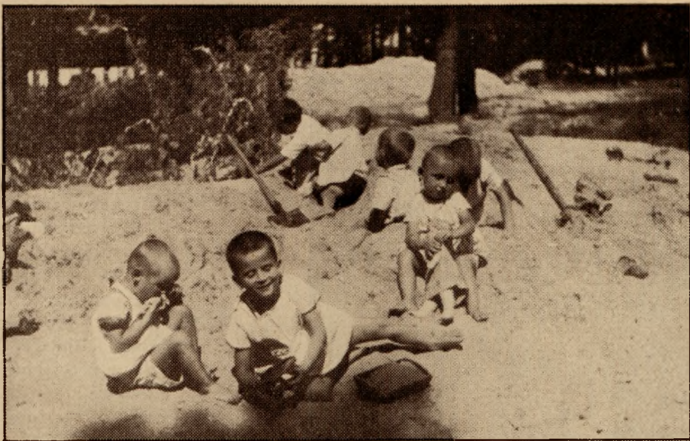
W dziecińcu — na piasku.

nej w oparciu o istniejące w całym kraju Ośrodki Zdrowia. Pierwszym etapem prac z omawianego zakresu jest propaganda higieny prowadzona przy pomocy żywego słowa, prasy i książki, wreszcie pokazów i wystaw.