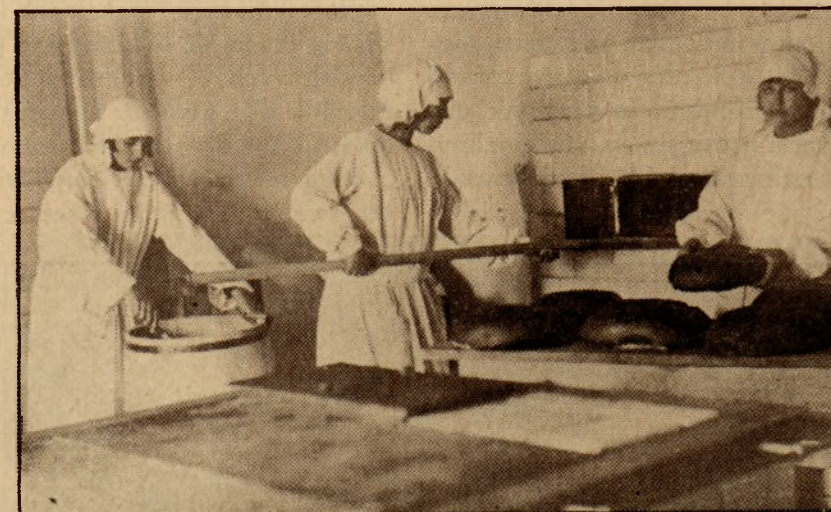
W spółdzielczej piekarni.

zmusza organizację do liczenia tylko na własne siły.