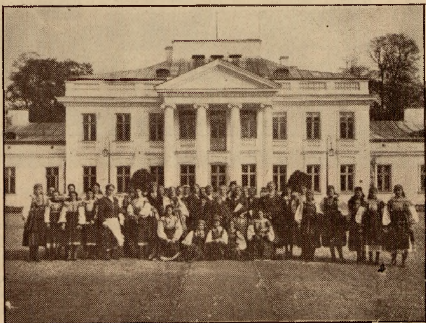
Zjazd powiatowy K. G. W.

Organizując akcję samokształceniową, brano pod uwagę nastę-