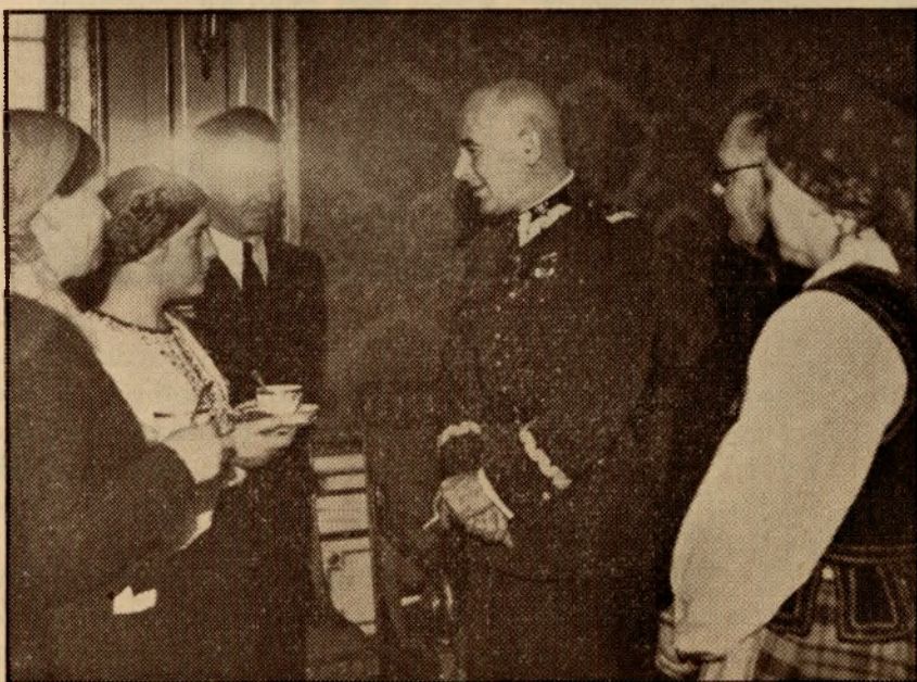
Na Zamku — gospodynie rozmawiają z Marszałkiem Polski.

Tu trzeba sięgnąć do historii z przed wielkiej wojny światowej i zaznaczyć, że Polska i Kanada by-