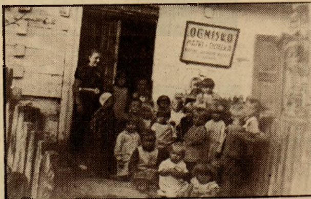
Przed Ogniskiem Matki i Dziecka.

We wszystkich tak Dziecińcach jak Ogniskach „Matki i Dziecka” jest prowadzone doży-