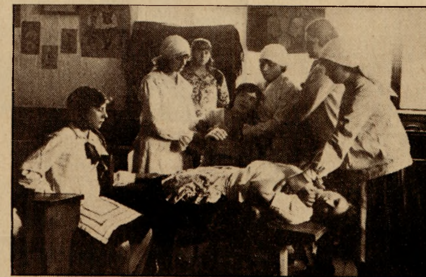
Kurs ratownictwa (sztuczne oddychanie).

wartość, że wydobywa maksimum możliwości twórczych z jednostki, która sama musi tworzyć na podstawie przeżyć, obserwacji, tekstów pieśni, czy starych żyjących we wsi obyczajów.