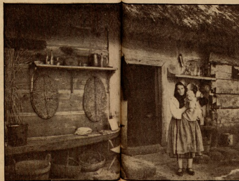
Przed chatą (od podwórza).

W świetlicach, a także w mieszkaniach członkiń, gdzie czasem odbywają się zebrania, korzystają członkinie z radia, które jako pomoc oświatowa jest coraz bardziej wykorzystywane przez organizacje. Rozgłośnia warszawska nadaje dwa razy w tygodniu audycje dla kobiet wiejskich, inne rozgłośnie coraz bardziej uwzględniają tę potrzebę.