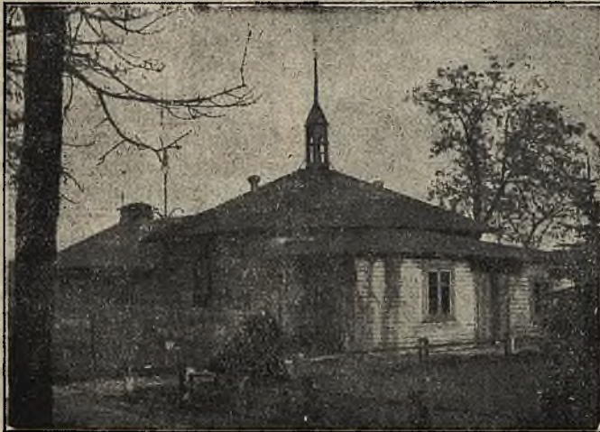
Drewniany kościółek pod wezwaniem Bożego Ciała w Warszawie. Na terenie kościołka i cmentarza ma być wzniesiony wielki kościół Opatrzności Bożej.